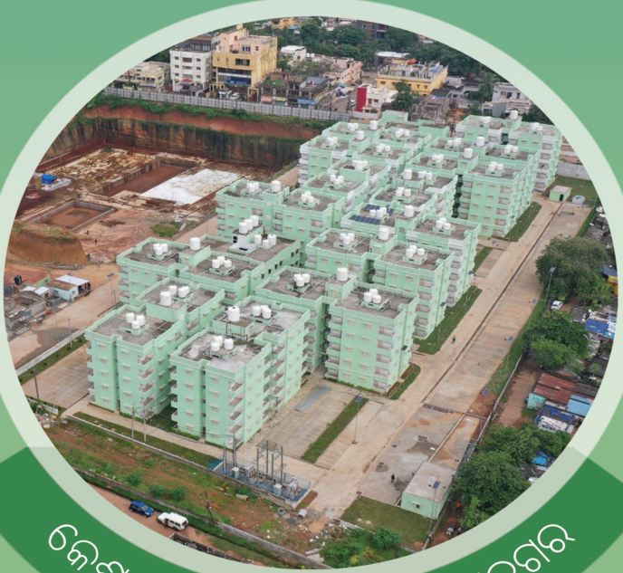
କେଶରୀ ରେସିଡେନ୍ସିଆଲ୍, ସତ୍ୟନଗର