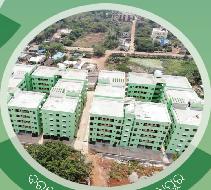
ଚିତ୍ରଶେଖର ଏନକ୍ଲେଭ୍, ସୁରୁଧ୍ରପୁର