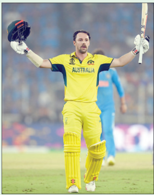
୧୩୭ ରନର ଇନିଂସ ଖେଳିଥିବା ଅଷ୍ଟ୍ରେଲିଆର ଟ୍ରେଭିସ ହେଡ୍ (ମ୍ୟାଚ୍ ଅଫ୍ ଦି ମ୍ୟାଚ୍)