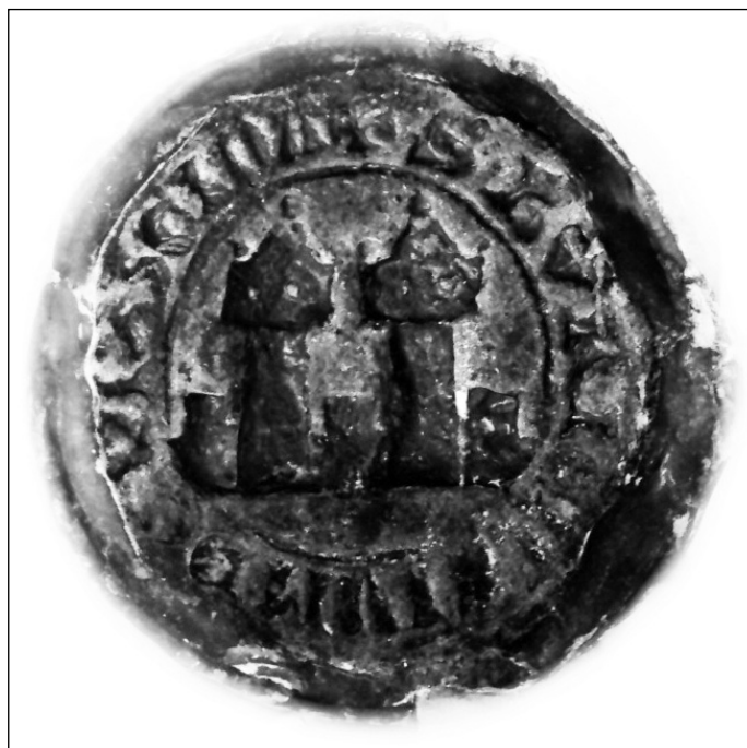
3. Odcisk pieczęci Byczyny z 1415 r., Archiwum Państwowe we Wrocławiu

herby o odmiennych godłach. Różnice dotyczą: 1. sposobu powiązania dwóch wież obronnych z murami miejskimi 19 i 2. kształtu zadaszenia obu wież 20 .