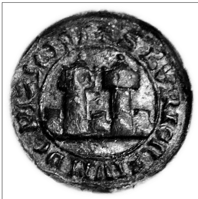
4. Odcisk pieczęci Byczyny z 1418 r., Archiwum Państwowe we Wrocławiu

polach obu odcisków nieznacznie różnią się. Różnice te zapewne wynikają z „ręcznej produkcji” odcisków. Być może do wykonania dwóch analizowanych odcisków użyto masy woskowej o innych właściwościach. Nie można wykluczyć też, że na ostateczną formę obu obrazów miały wpływ: 1. kąt nacisku typariusza na miękką, woskową powierzchnię, 2. przesunięcie typariusza w płaszczyźnie poziomej w czasie pieczętowania. Tym samym — jeśli to rozumowanie jest poprawne — o formie znaku miejskiego Byczyny utrwalonego w woskowych odciskach (rysunek godła) z początku XV w. zdecydowały de facto uwarunkowania techniczne, związane z czynnościami pieczętowania.