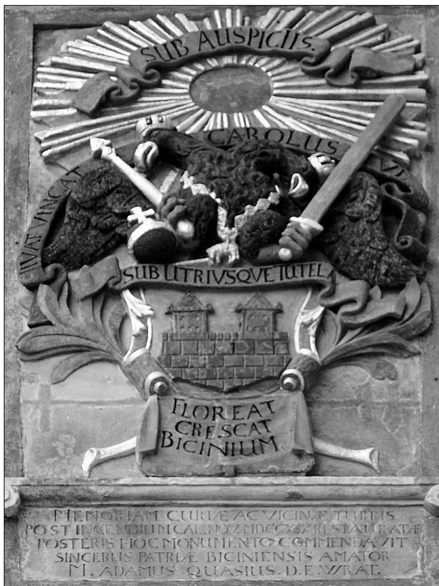
7. Ratusz w Byczynie. Dekoracja heraldyczna z 1719 r.

może od pieczęci z datą 1588 pochodzą wszystkie te wersje herbu Byczyny, w których wąski pas umocnień dzielący pole pieczęci lub pole tarczy na dwie części — górną i dolną, właściwy dla obrazu średniowiecznej pieczęci, został zastąpiony murem szczelnie wypełniającym całą dolną część pola pieczęci lub podstawę tarczy herbowej 27 . Szczegółem, nad którym warto się pochylić, są zwieńczenia obu wież miejskich Byczyny. Na odcisku z 1706 r. można dostrzec dachy wież zbudowane z trzech połączonych, wysokich trójkątów. Każdy wierzchołek „potrójnego” dachu został zwieńczony ozdobną kulą.