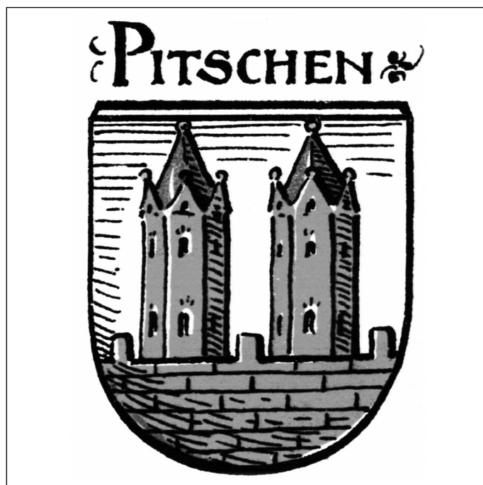
6. Herb Byczyny z II połowy XIX w., O. Hupp, Wappen und Siegel der deutschen Städte, Flecken und Dorfer , Frankfurt 1898

narysował godło miejskie Byczyny Otto Hupp w 1898 (il. 6) i w 1915 r. 24 Uwaga o umiejscowieniu wież na murze nie dotyczy natomiast dobrze narysowanego godła Byczyny, opublikowanego w herbarzu śląskim z 1870 r. 25 (il. 5). Jego autor — Hugo Saurma — poprawnie nawiązał do obrazu z pola XIV-wiecznej pieczęci. Wersja herbu Byczyny z 1870 r. w dużym stopniu pokrywa się z treścią tzw. wciérki, opublikowanej przez Mariana Gumowskiego w 1960 r. w popularnym herbarzu miast polskich (il. 2). Inny sposób wykreślenia godła Byczyny przez obu przywołanych heraldyków niemieckich w II połowie XIX i na początku XX w. był konsekwencją ich metodologicznych preferencji. Otto Hupp uważał, że o kształcie herbu miejskiego decydują wyobrażenia ze źródeł najbliższych czasom tworzenia „nowego” herbu, a Hugo Saurma w tym samym celu wykorzystywał znaki najstarsze.