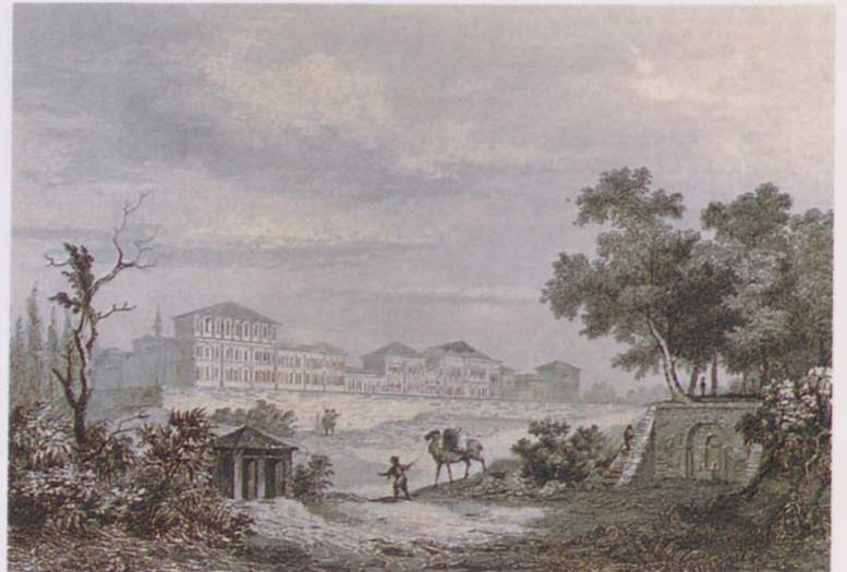
Jouannin’in kitabından alınma gravür; arka planda Topçu Kışlası, ön planda Büyük Mezarlık betimlenmektedir.

Nerval’in betimlemelerine göre ise: “Kışlanın (Topçu Kışlası) cephesini geçince insan kendini yalancı çınarların ve çam ağaçlarının gölgesi altında uzanan büyük bir düzlüğün, Büyük Mezarlık’ın girişinde bulur. Öncelikle, üzerine mermer bir banka kurulurcasına tereddütsüz oturulabilen uzun düz mezar taşlarına kazınmış İngilizce kitabe ve armalarla göze çarpan frenk mezarlığından geçilir. Denize hâkim bir alanda, köşk şeklinde bir kahvehane yükselir. Buradan Asya kıtası rahatlıkla görülebilir.” (2) Geçen yüzyıllarda mezarlıklar “şehirlerin bahçeleri”ydiler. (3)