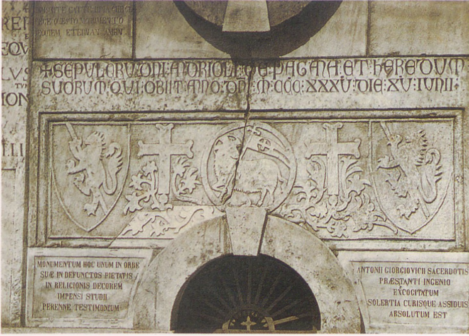
M. Sebah tarafından çekilmiş olan, 14. yüzyıla ait mezar taşının fotoğrafı (13. Tutanak).