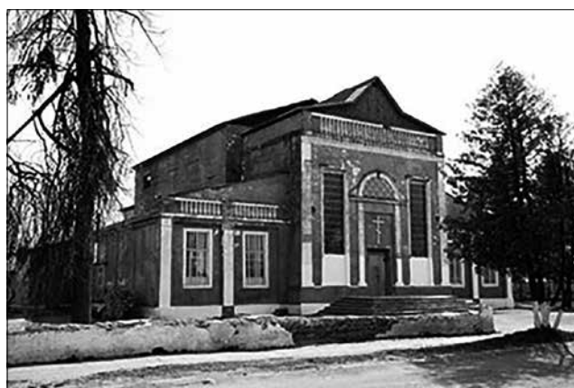
Рис. 13. Покровська церква. Фото 2021 р.

будинок (12,8 x 8,5 x 3,6 м) для проживання священника. Будинок стояв на кам'яному фундаменті, був критий залізом, опалювався трьома голландськими печами. У одній зв'язці з будинком була дерев'яна кухня. У дворі знаходився старий цегляний погріб. У 1907 р. там збудували ще й амбар, у 1909 р. – конюшню, навіс та сарай. За 55 сажнів на захід від церкви знаходився попечительський (опікунський) будинок для малозабезпечених [6, арк. 21–27]. Воронізькі більшовики першою закрили Покровську церкву у 1929 р. й перетворили її на пролетарський клуб цукровиків [7, с. 63]. Тож бо церкві пощастило, що її не зруйнували. Вона й досі була б танцювальним клубом для вороніжців, якби у 1990-х рр. не перестала диміти труба воронізької цукроварні. У 2005 р. Покровська церква відновилася у своїх високих кам'яних стінах 1854 р.