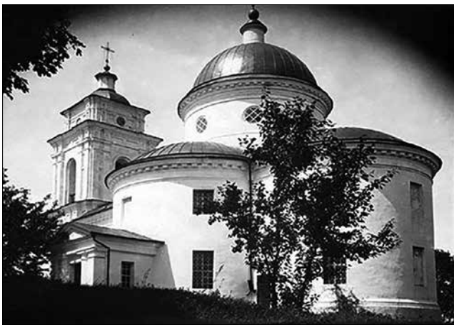
Рис. 4. Успенська церква. Фото 1920-х рр.

Воронежі. У 1888 р. поряд з Успенською церквою збудували дерев'яний церковно-причтовий будинок (14,2 x 8,5 x 3,5 м) для проживання священника. У його дворі знаходилися кухня, два амбари, хлів, конюшня, цегляний погріб, сарай та навіс. У 1890 р. збудували біля церкви сторожку (3,6 x 2,9 x 2,1 м). До революції у власності Успенської церкви перебували на Базарній площі 6 дерев'яних лавок загальною довжиною в 43,1 м [6, арк. 52–60]. У квітні 1922 р. на Пасху воронізькі більшовики позбавили Успенську церкву всіх її дорогоцінностей, срібних чаш, напрестольних хрестів, розтрощили іконостас та спалили ікони [7, с. 37]. У 1931 р. церква була закрита й поступово, по черзі за списком та попередньої сплати, найбідніші