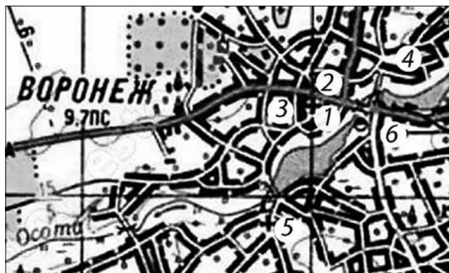
Рис. 2. Воронізькі церкви на кілометровій карті 1986 р.

знаходилася за сто сажнів від Михайлівської церкви, ліворуч Глухівської брами – в'їзних воріт до фортеці (нині Київська вулиця з пам'ятною стилізованою баштовидною спорудою до 800-ліття Вороніжа). Успенська церква стояла впритул до подвійного частоколу (палісаду) з загострених смолянистих паль у два сажні висотою поверх земляного валу над хащами болотистої Гудимівки, правої притоки Воронця (нині Осоти). Церква звалася в народі Пречистенською, відповідно й куток Вороніжу звався Пречищиною. У церкві зберігалася місцево шанована ікона Божої Матері – «Троеручиця», прославленої в межах всієї Чернігівської єпархії. «Троеручиця» вже до 1756 р. створила «28 чудес», підтверджених свідченнями зцілених нею віруючих [2, с. 340].