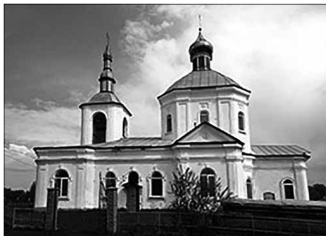
Рис. 12. Преображенська церква. Фото 2021 р.