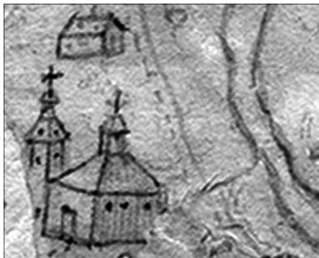
Рис. 1. Пирогівська церква на плані 1708 р.

2. Успенська церква (рис. 4) була збудована вже після відновлення воронізької фортеці, спаленої поляками, військами короля Яна Казимира взимку 1664 р. Церква