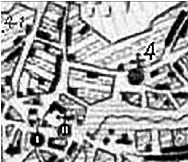
Рис. 9. Фрагмент трьохверстової карти 1863 р.