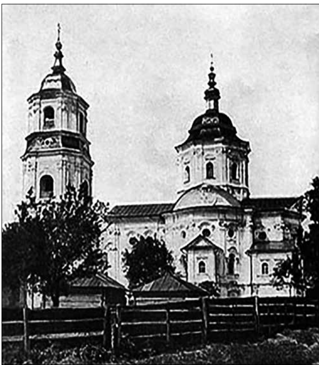
Рис. 3. Михайлівська церква. Фото М.Я. Рудинського 1925 р.