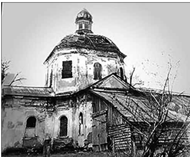
Рис. 11. Преображенська церква. Фото 1981 р.

ного реєстру нерухомих пам'яток України за категорією «місцевого значення» та надали новий охоронний номер 4706-См [9]. Церква є привабливою для туристів своїм місцем знаходження – посеред між козацьким та літописним Воронежем, розташованим дещо униз по Воронцю (Осоті).