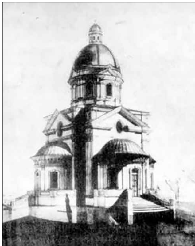
Рис. 8. Троїхсвятительська церква в Лемешах