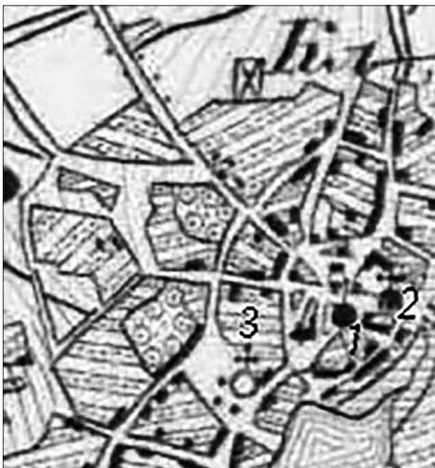
Рис. 6. Фрагмент трьохверстової карти 1863 р.

в 1894 р. Уявлення про вигляд Троїцької церкви надає проєкт її будівництва (рис 7), затверджений у Чернігові 1893 р. і опублікований 2015 р. в книзі «Любитове – моє рідне село», яку написав уродженець цього села Василь Григорович Кремень, колишній міністр освіти та науки України у 2000–2005 рр. [3, с. 136]. Троїцька церква була, як і всі воронізькі церкви, одноверха. Простояла вона в Любитовому ще півстоліття, доки не була зруйнована більшовиками. У 2014 р. у Любитовому була споруджена нова кам'яна Троїцька церква.