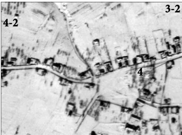
Рис. 10. Фрагмент німецької аерофотографії 1942 р.

Пантелеймона Куліша, майбутнього письменника (1819–1897). На трьохверстовій карті 1863 р. церква позначена під № 4 (рис. 9). Вона вже не мала приходу, бо так само, як і Троїцька, підпала під скорочення кількості самостійних церков у Воронежі за наказом Чернігівського єпархіального начальства 1862 р. та зі згоди мешканців містечка [8, с. 300]. Отже, дві церкви, Трьохсвятительська та Троїцька, були закриті, а їхні прихожани перейшли до Михайлівської та Успенської церков відповідно. Тому й не маємо в архівах метричних книг цих двох скорочених церков після 1862 р. Також ці дві церкви відсутні в розписі приходів Чернігівської єпархії 1876 р. [10]. Трьохсвятительська церква не була розібрана, вона відновилася. Підтвердженням її існування є данні 1911 р. щодо кількості прихожан церкви [7, с. 76]. Також маємо страховий опис Трьохсвятительської церкви за 1910 р., де вказано, що біля церкви стояла дерев'яна сторожка (10 x 4,2 x 2,1 м) [6, арк. 44–51]. У 1931 р. більшовики закрили Трьохсвятительську церкву. На німецькій аерофотографії