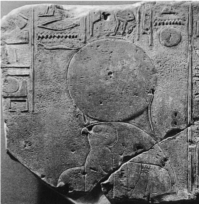
Afb. 1. De god 'Re-Horus-van-de-Horizon die juicht aan de Horizon in zijn naam/identiteit van Licht dat in de Aton is', zoals het bijschrift luidt. Later wordt deze lange naam in twee koningscartouches geschreven. Berlijn 2072 (detail).

voor. Men heeft dan ook wel gesteld dat de Aton niets anders is dan een van de namen of aspecten van de zonnegod Re die in die zin dus al lang voor de Amarna-periode vereerd werd. Ook Egyptologen die niet zover willen gaan te zeggen dat de Aton als god al in het Middenrijk in de bronnen voorkomt, vermelden vaak wel dat de Aton in elk geval al tijdens de regering van Toethmosis IV, de grootvader van Achnaton, als god werd vereerd. Toch moeten wij denk ik een onderscheid maken tussen het gebruik van het woord aton voor de zon en de aanduiding van een specifieke vorm van de zonnegod die als een aparte godheid wordt vereerd. In die laatste betekenis komt de Aton pas op tegen het eind van de regering