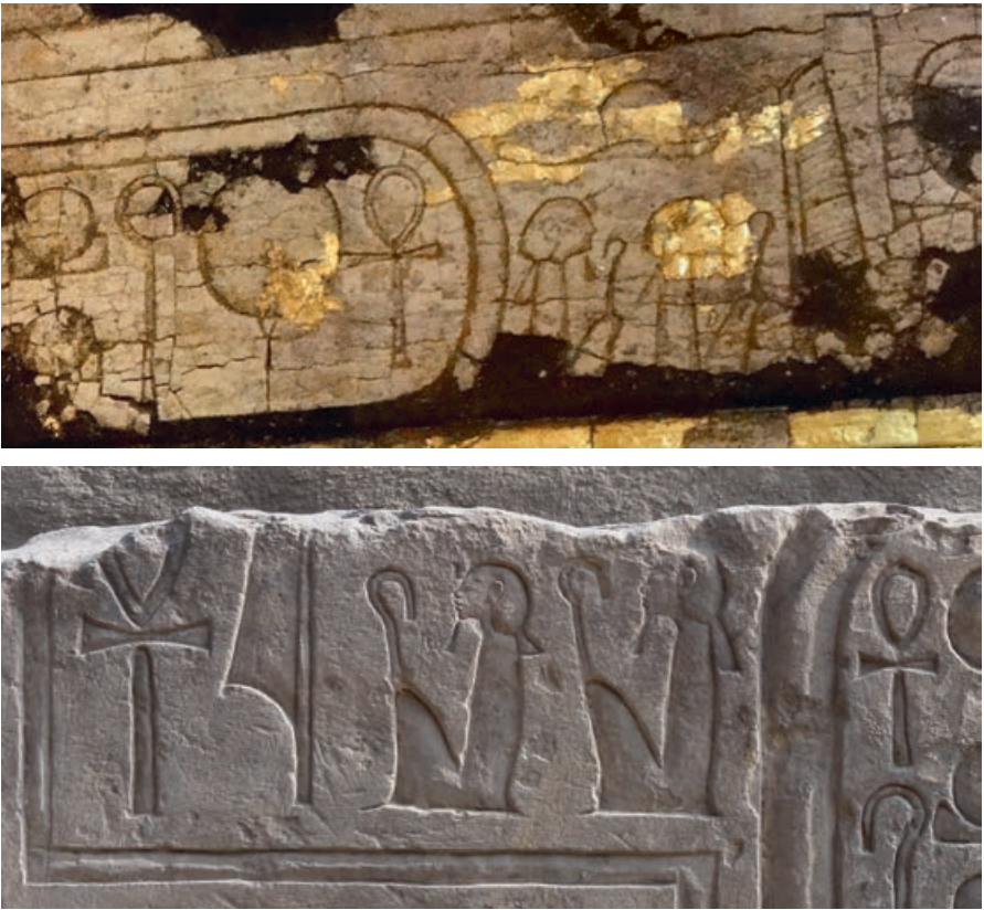
Afb. 4. Twee voorbeelden van de woorden 'Mijn vader leeft' die voorafgaan aan de naam van de Aton. Zowel het woord 'vader' als het suffix voor 'mijn' zijn met een zittende koning met heersersscepter geschreven. Boven: detail van de grafinschrijving van koningin Teje, oorspronkelijk uit Amarna, later hergebruikt in het fameuze graf KV 55 in het Dal der Koningen. Onder: detail van een talatat -blok uit Luxor.

sprekend wordt opgevoerd heeft het suffix van de eerste persoon enkelvoud de vorm van een zittende koningsfiguur en ook als Achnaton de Aton aanduidt als 'mijn vader' heeft dit woord zo'n koningsfiguur als determinatief (afb. 4). De namen van de Aton worden in koningsinscripties vaak vooraf gegaan door de woorden 'mijn vader leeft' en Achnaton wordt niet moe te benadrukken dat hij 'de volmaakte zoon van de levende Aton' is.