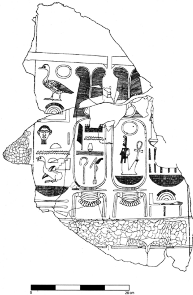
Afb. 6. Lijntekening van een gereconstrueerde inscriptie op zuilen in het graf van de vizier Amenhotep-Huy. De cartouches van Amenhotep III, met in de meest linkse kolom de titel 'hij die verschenen is op de tjentjat'. Tekening van Fernando Baéz; © IEAE. Bron: F. Martín Valentín en T. Bedman, in: D.C. Forbes (red.), Amarna Letters 5 . Weaverville 2015, 73.