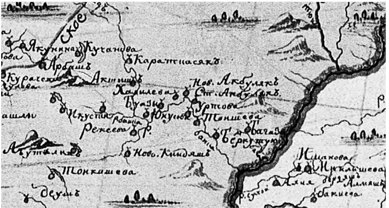
Карта Уфимского наместничества 1781 г. (фрагмент)

лесом и по сю сторону Уфы реки степная сторона, а которой есть сосняг на степной стороне — борти не делать, только на хоромное строение бревна рубить, а черным лесом и степью владеть обща. И в тех в вышеписанных межах и урочищах ему, Юнусу, в лесу борти делать, и всякого зверя побивать, и бобров и птицу, и рыбу ловить, и двором поселитца, где похочет, кроме озер Мрясима и Огаша, пашня похоть, и сено косить. ...» 1 .