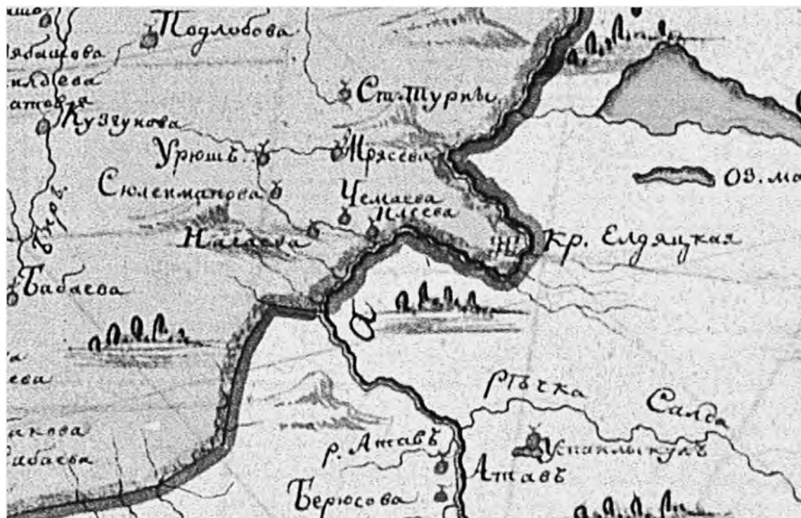
Карта Уфимского наместничества 1781 г. (фрагмент)

Восточные пределы расселения башкир рода Ельдяк протянулись до долины реки Уфа и ее притоков – рр. Урюш, Ургуш и др. на стыке современных Благовещенского, Нуримановского и Караидельского районов. На Карте Уфимского наместничества 1781 г. на правом берегу реки Караидель (Уфа) отмечена крепость Ельдяцкая 1 . По поводу этой крепости в 1762 г. историк и географ Петр Рычков написал следующее: «Ельдяцкая крепость, в Башкирии Сибирской дороги на р. Уфе, между гор, от города Уфы 160, а от Оренбурга 493 версты. Она построена при статском советнике Кирилове в 1735 г. Звание ее происходит от башкирской Ельдяцкой волости, ибо стоит на земле той волости башкирцев. Гарнизону в ней ныне половина роты пехотной да служивых казаков 100; жительство дворов со 100; церковь во имя Нерукотворенного образа Спаса; укреплена с наружной стороны оplotом».