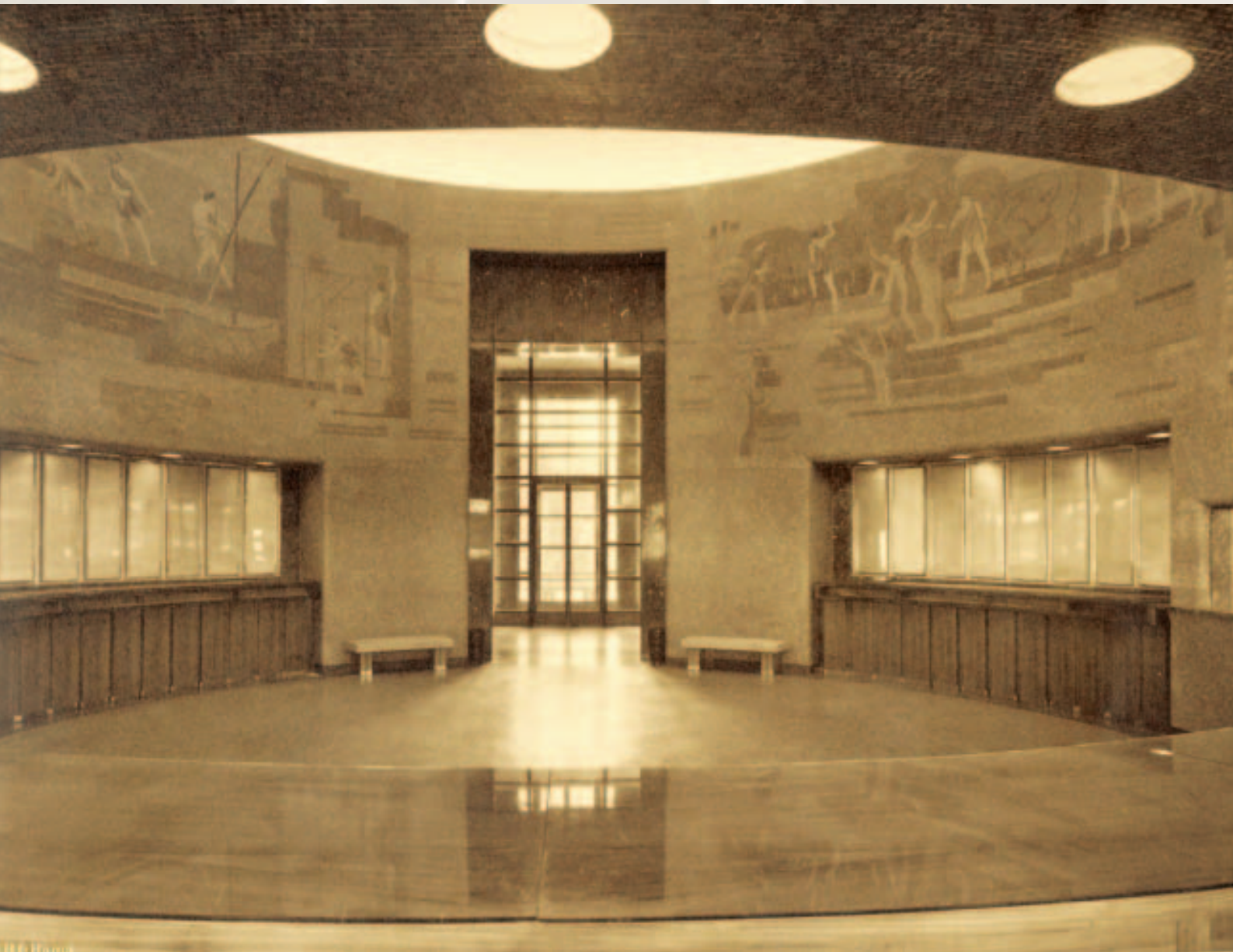
Salla e klientëve, foto Vassari, 1938.