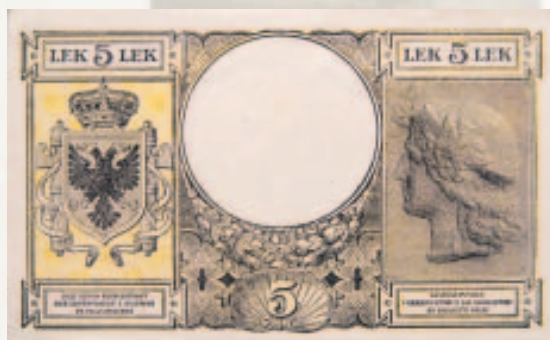
5 Lek të vitit 1940