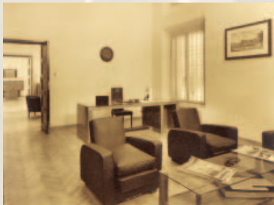
Ambiente të brendshme të godinës, foto Vassari.