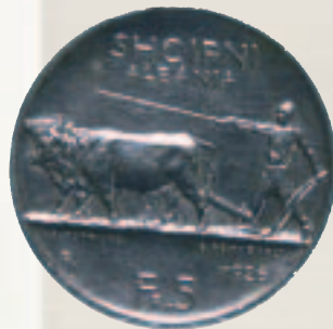
5 franga ari 18.11.1926