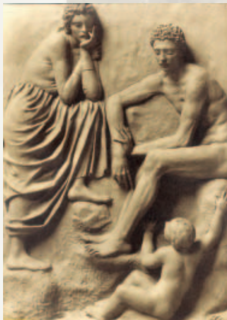
Fragment nga basorelievi prej qeramike që ndodhet në portalin e hyrjes, autor skulptori italian Biagini.

Art. 6 Ministri i Financave ngarkohet me zbatimin e këtij dekretligji.