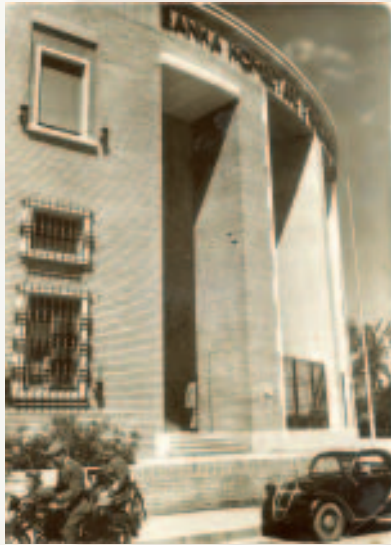
Pamje e portalit të hyrjes.