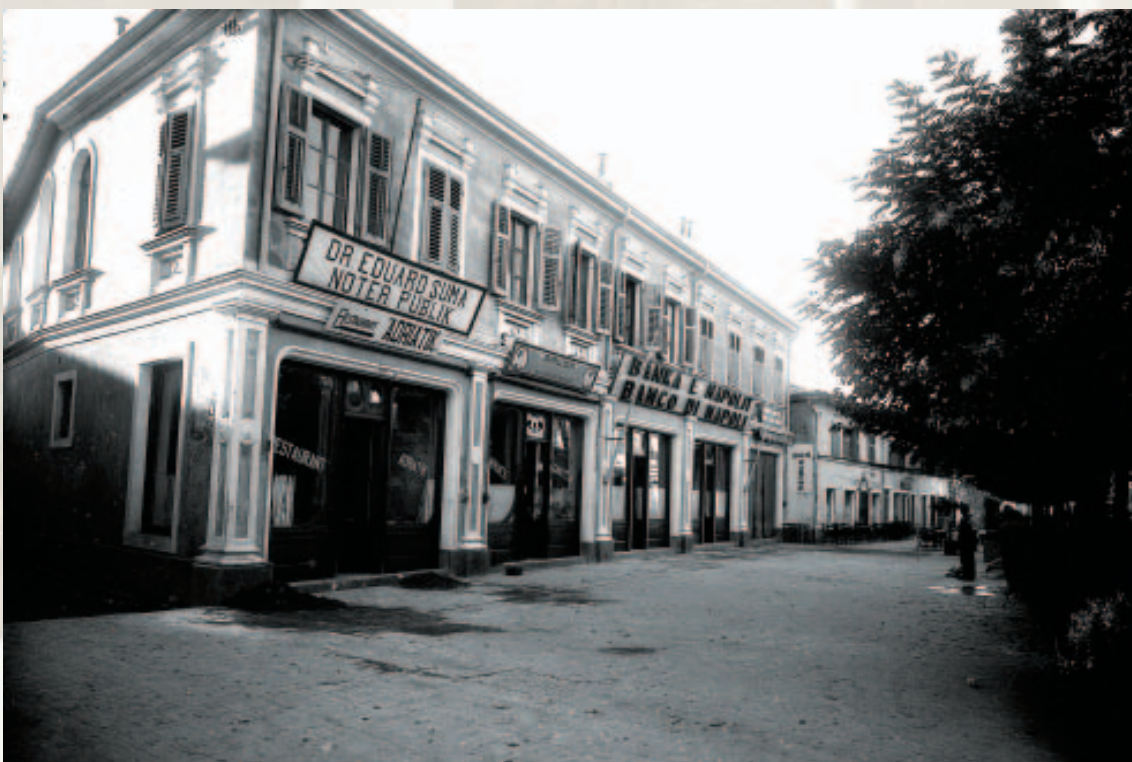
Foto e selisë së Banco di Napoli-Albania, Shkodër, 1938.

Banco di Napoli-Albania hapi degën e saj edhe në Korçë.