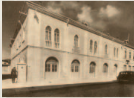
Foto e Degës së Bankës Shkodër.

Me datë 30 me urdhër të Komandës, Divizioni i Dytë, kasafortat janë mbyllur. Janë tërhequr me urdhër të komandës partizane, një pako me mall nga magazinat e përgjithëshme dhe revolja e rojes së atyre magazinave. Gjendja e arkës së degës në kartëmonedha, në monedha metalike e në çeqe është 129.800 franga shqiptare. Nga ana tjetër, dega disponon module çeqesh për t'u vlerësuar për gati 1.800.000 franga shqiptare.