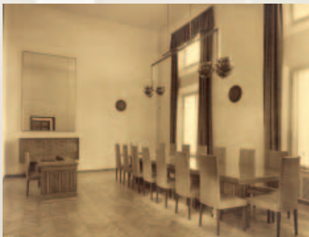
Salla e Këshillit Mbikëqyrës.