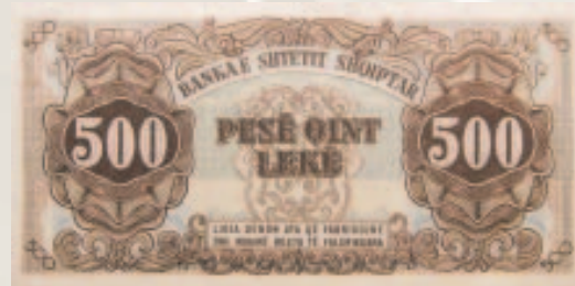
Seria e parë e re e kartëmonedhave të vitit 1945.