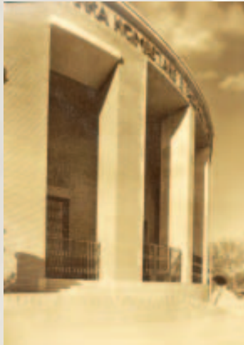
Pamje e fasadës lindore të godinës së Bankës, 1938.

Ne e dimë mirë se një Institut emisioni, para se t'u sigurojë fitime materiale aksionerëve të vet (aksionerët tanë në të vërtetë, nuk marrin veçse një shpërblim modest të kapitalit të tyre) duhet të vendosë që të kryejë një mision të lartë, atë të mbrojtjes së interesave kombëtare në lëmin monetar dhe ekonomik.