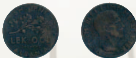
0.05 Lek, 1940

Miratohet dekreti për emisionin e monedhave prej 2 lekë dhe dekretet për emisionet e monedhave të tjera. Monedhat e hedhura në qarkullim kishin simbole që paraqitnin pushtimin e Shqipërisë nga Italia fashiste.