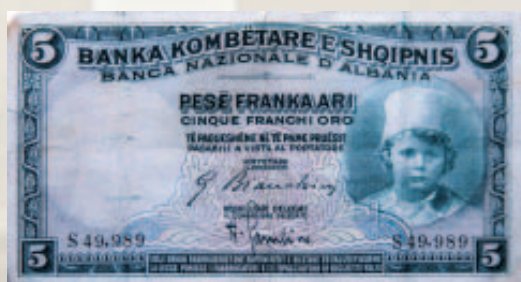
5 franga ari 1926