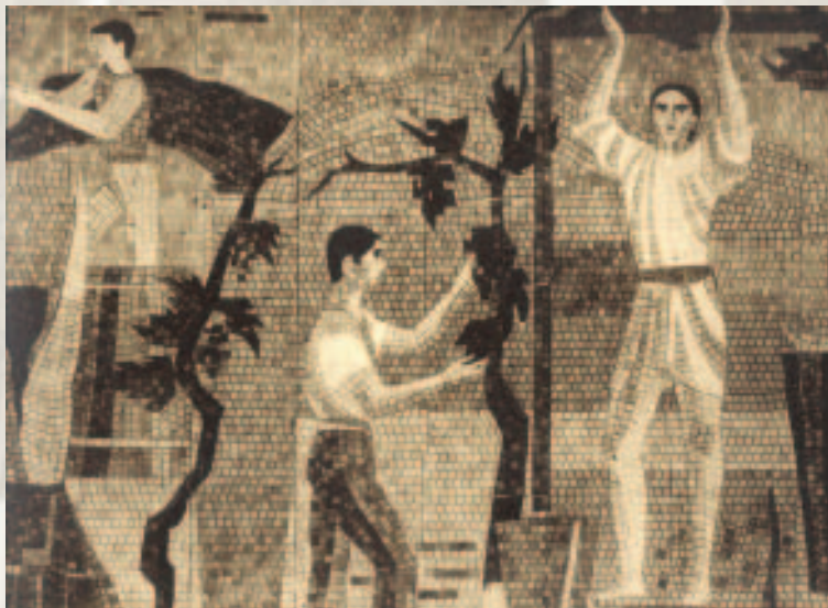
Mozaik në hollin e Bankës së Shqipërisë.

Këshilli Mbikëqyrës i Bankës së Shqipërisë me vendimin nr.42, miraton rregulloren "Për investimet nga bankat në kapitalin e shoqërive tregtare". Qëllimi i kësaj rregulloreje është vendosja e ekuilibrit ndërmjet aktivitetit të lirë të investimit të bankave në kapitalin e shoqërive tregtare dhe respektimit të detyrueshëm të disa raporteve mbikëqyrëse. Objektivi i vendosjes të raporteve mbikëqyrëse sipas kësaj rregulloreje është që bankat të mos ushtrojnë në mënyrë të pakufizuar investimin në kapitalin e shoqërive tregtare, në mënyrë që ato të mos përballen në mënyrë të pakontrolluar, me rreziqe të kësaj natyre.