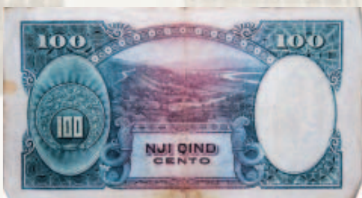
100 franga ari 1926