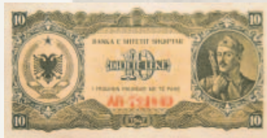
Kartëmonedha 10 lekë e vitit 1947.

Zbatohet reforma e dytë monetare. Në bazë të kësaj reforme u hoqën nga qarkullimi kartëmonedhat e emisionit të Bankës së Shtetit Shqiptar, të emetuara në vitin 1946, si dhe kartëmonedhat dhe monedhat metalike, të emetuara nga ish-Banka Kombëtare e Shqipërisë, të cilat ishin lënë përkohësisht në qarkullim. Banka e Shtetit Shqiptar emeton kartëmonedhën e re në lekë 10, 50, 100, 500 dhe 1000 lekë, si dhe monedhën metalike me prerje 0,50, 1, 2 dhe 5 lekë. Këmbimi u bë në raportin 1 frang baraz me 9 lekë ose baraz me 9 dinarë. Në këtë raport u vlerësuan edhe çmimet e mallrave, shërbimet publike e private, qiratë, pagat e punës, debi-kreditë, të ardhurat e shpenzimet, tatimet e taksat etj..