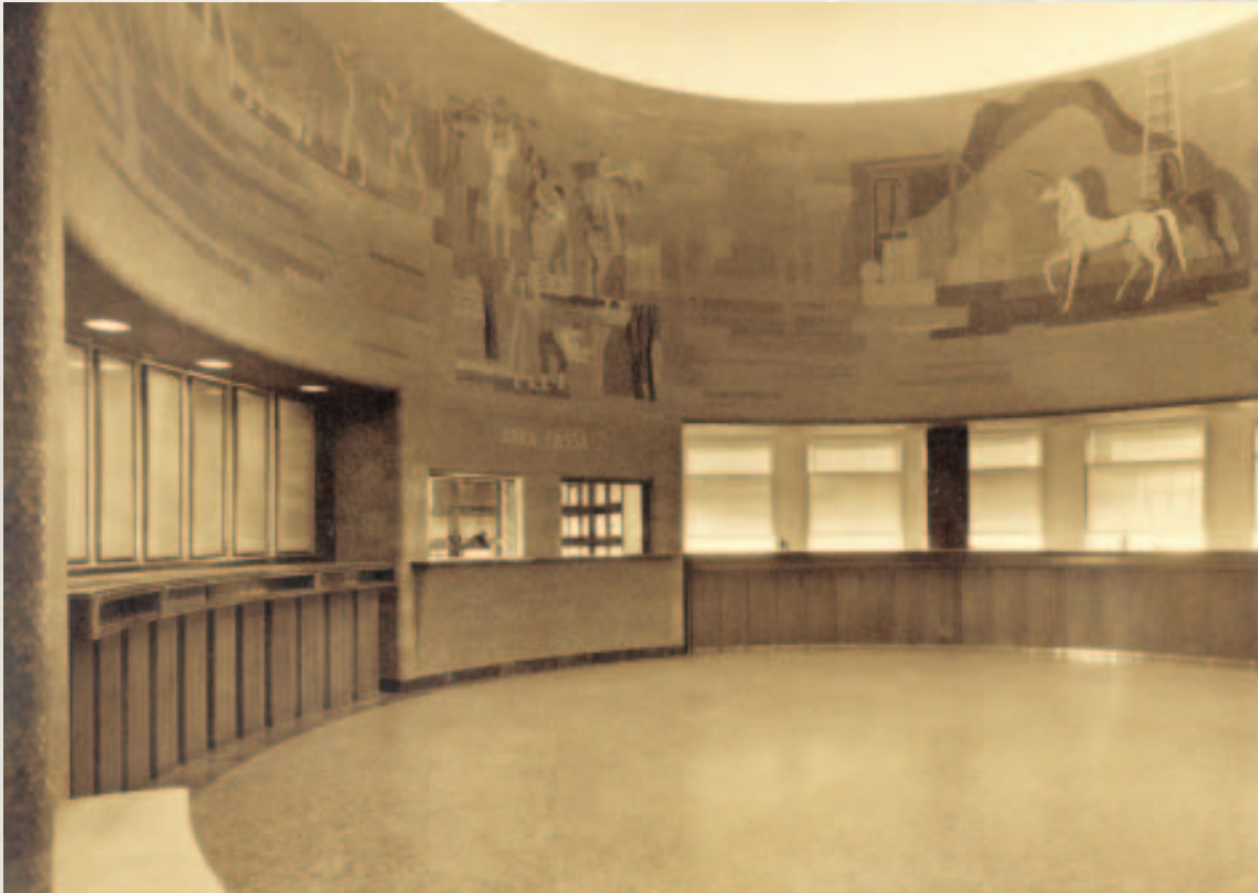
Pamje nga holli i sallës së klientëve.