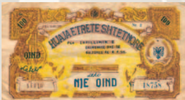
U emetua huaja e tretë shtetërore, 1954.

Këto obligacione jepnin të drejtën për zhvillimin e llotarive. Të ardhurat (interesat) që jepnin të gjitha obligacionet, paguheshin me llotari fitimi. Shuma e fitimeve u caktua për 20 vjet të huasë në masën 4 për qind në vit.