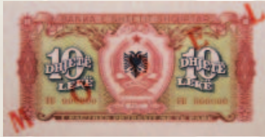
10 Lekë e vitit 1957.