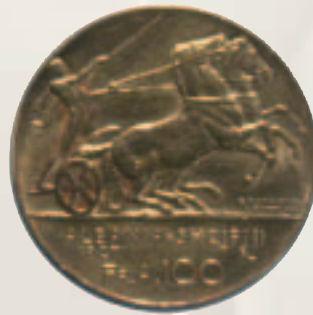
100 franga ari 1927