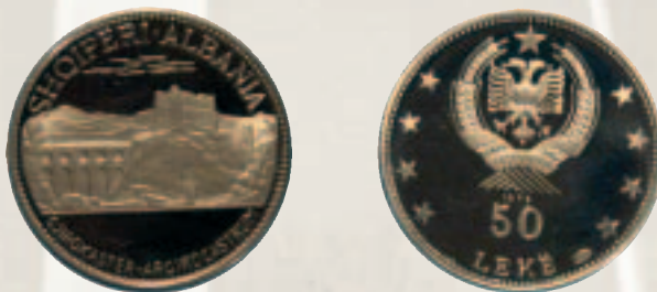
Monedhë përkujtimore e vitit 1968.

Emetohen monedha përkujtimore me rastin e 500-vjetorit të vdekjes së Heroit Kombëtar, Gjergj Kastrioti Skënderbeu.