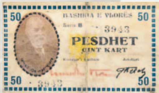
50 qind kart, 01.05.1924 (Kartëmonedhë e Bashkisë së Vlorës).

Qeveria nxori një ligj që autorizonte bashkitë e vendit të emetonin kartëmonedha në një shumë deri në 80 mijë franga ar dhe në prerje të ndryshme. Mbështetur në këtë ligj, bashkitë e Shkodrës, të Korçës, të Vlorës, të Fierit etj., nxorën në qarkullim kartëmonedhat e tyre.