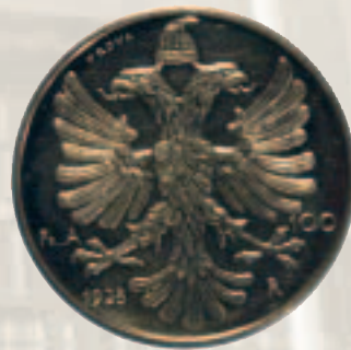
100 franga ari 15.12.1928