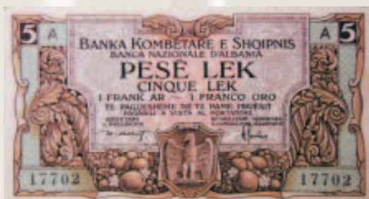
5 Lek/1 frank ar 1926

Filloi hedhja në qarkullim e bankënotave me prerje 20 franga ar në sasinë 5.000 franga ar, pasuar me sasi të tjera pothuaj çdo dhjetëditor. Po ashtu, filloi edhe hedhja në qarkullim e bankënotave me prerje 5 franga ar.