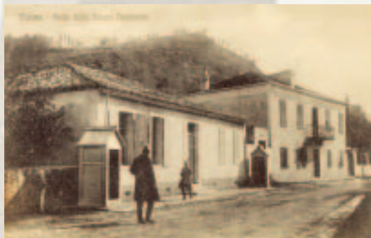
Foto e godinës ku u vendos fillali i Bankës Kombëtare të Shqipërisë në Vlorë.

Hapet Filiali i Bankës Kombëtare të Shqipërisë në Vlorë.