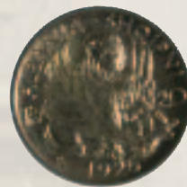
20 franga ari 21.08.1926