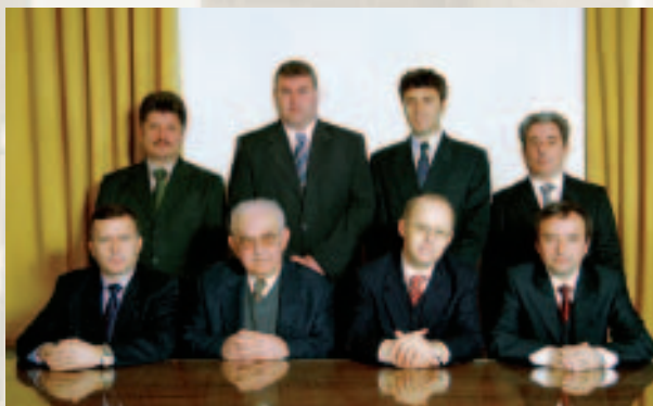
Këshilli Mbikëqyrës i Bankës së Shqipërisë.

Kjo rregullore përmban në mënyrë të detajuar kërkesat për aksionet e propozuara të bankës, përcaktimin e aksionerëve direkte dhe indirekte të bankës, në zbatim të parimit 2, të Komitetit të Bazelit, për një mbikëqyrje të kujdesshme si dhe rritjen e transparencës së procesit të licencimit nëpërmjet publikimit të kërkesave.