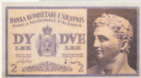
Dy lek i vitit 1944.

Funksionarët e Bankës së Shtetit Shqiptar të ngarkuar me marrjen në dorëzim të situacionit kontabël të ish- Bankës Kombëtare të Shqipërisë konstatojnë se situacioni i datës 31 dhjetor 1944 i Bankës Kombëtare të Shqipërisë, nuk përfshin gjithë gjendjen e pasurisë të ish-Bankës Kombëtare të Shqipërisë, mbasi këtij i mungojnë shumë zëra si : kapital, fond rezervë, fond amortizimesh, fitimet e gjestionit Romë për vite të ndryshme, e të tjera.