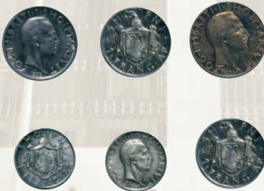
1 frang ar 28.03.1935