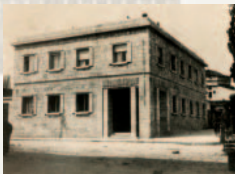
Pamje e Degës së Bankës Elbasan, foto e viteve '30.

art.23- Ministri i Financave ngarkohet me zbatimin e këtij ligji.