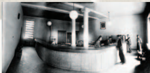
Filiali i Shkodrës, Marubi 1926.