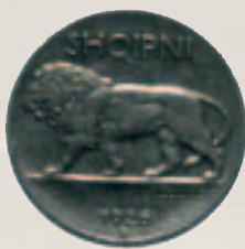
1/4 Leku 01.09.1926