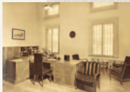
Ambiente të brendshme të godinës, foto Vassari.