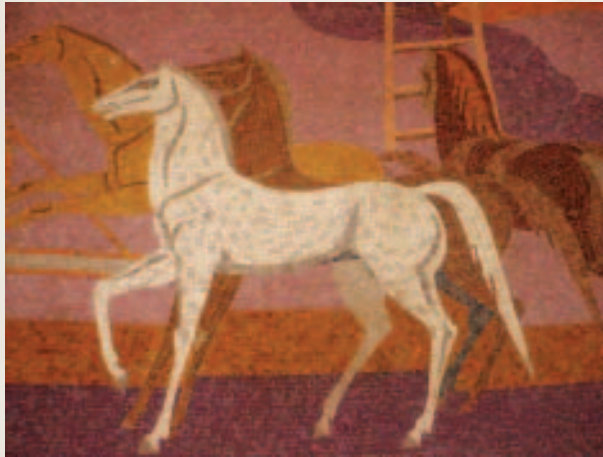
Mozaik në hollin kryesor të Bankës së Shqipërisë.