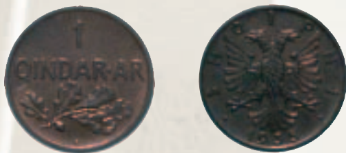
1 qindar ar 28.03.1935

Ajo e zhvilloi veprimtarinë deri në vitin 1939.