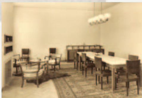
Ambjent i brendshëm.

Në kuadrin e veprimtarisë së Bankës Kombëtare të Shqipërisë të zhvilluar në këtë fazë, duhet theksuar dhe bashkëpunimi i saj me organet më të larta të Shtetit Italian për financimin e ushtrisë me kartëmonedha shqiptare gjatë operacioneve ushtarake.