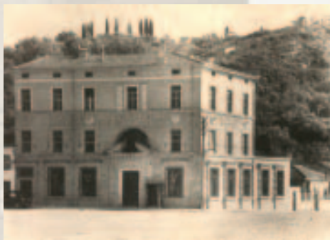
Foto e Degës së Bankës Vlorë.

Drejtoria e Vlorës duke paraparë në anën tjetër faktet, kishte fshehur menjëherë gati 500.000 franga ari, që momentalisht paraqesin disponibilitetin në likuiditete të kësaj dege. Nuk mund të përcaktojmë cilat janë dëmet eventuale të pësuar nga shërbimi i magazinave të përgjithshme, përsa i përket ndërtesës dhe mallrave. Që nga data e çlirimit dega është mbyllur me urdhër nga lart.