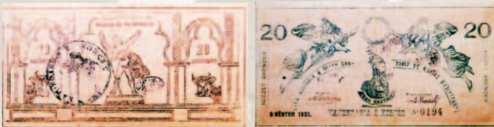
20 Skënderë 9.11.1921, emetuar me rastin e caktimit të kufijve të Shqipërisë.

U vendos për herë të parë, që nxjerrja e të ardhurave shtetërore të llogaritej mbi bazën e frangut ar, sipas këtij kursi : lira stërlinë barazohej me 25 franga ar, lira turke me 22 franga ar, napoloni me 20 franga ar. Këtij kursi i bëhej një zbritje prej 10 për qind për kartëmonedhat e ndryshme (përveç dollarit) dhe një zbritje prej 5 për qind për monedhat e argjendta.