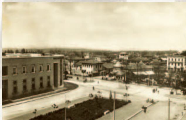
Pamje te zyrave, foto Vassari, 1938.

I frymëzuar nga këto ndjenja, Ju ftoj, Zotërinj, të brohoritni me mua për fatet e mbara të Shqipërisë."