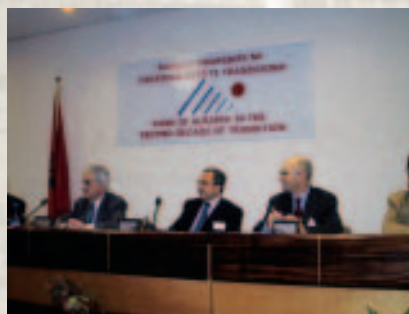
Kryeministri i Shqipërisë, z. Fatos Nano

Foto nga Konferenca III Kombëtare "Banka e Shqipërisë në dekadën e dytë të tranzicionit".