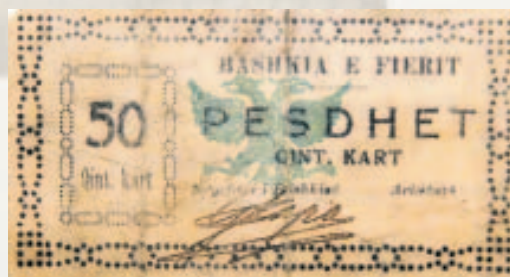
50 qind kart, 1924 (Kartëmonedhë e Bashkisë së Fierit).