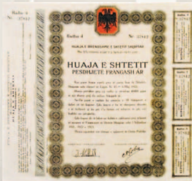
Huaja e Brendshme e Shtetit Shqiptar, 1920.

Me ligjin nr. 41 të kësaj date, u emetua huaja e brendshme e Shtetit Shqiptar me prerje 50 franga ari . Kjo hua përbëhej nga një radhë me 40.000 pjesë të një shume prej 2 milionë frangash ari. Secila pjesë e radhës kishte çmimin 50 franga ari dhe ndahej në tri kupona. Çdo kupon kishte të shënuar shumën e të hollave, që do të shlyhej deri në fund të vitit si dhe përqindjen e interesit. Çdo kupon ishte caktuar, nga arkëtarët e zyrave të financave të shtetit, të shlyhej deri në 1 nëntor të viteve 1921, 1922, 1923.