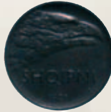
10 qindar Leku 8.02.1926