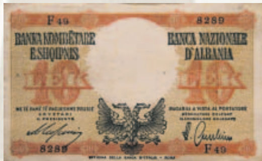
pamje pas 10 Lek, 1940