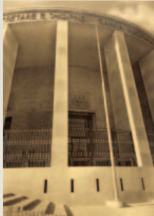
Banka e Shqipërisë, 1999.

Këshilli Mbikëqyrës i Bankës së Shqipërisë me vendimin nr. 26 miraton rregulloren "Për dhënien e licencës për të ushtruar veprimtari financiare nga subjektet jobanka në Republikën e Shqipërisë". Subjekte jobanka janë konsideruar ato subjekte që kryejnë aktivitetet e përcaktuara për t'u kryer nga bankat, në nenin 26 të ligjit "Për bankat në Republikën e Shqipërisë" me përjashtim të grumbullimit të depozitave.