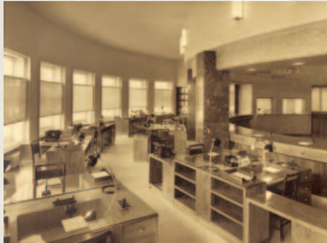
Salla e kontabilitetit, foto Vassari.