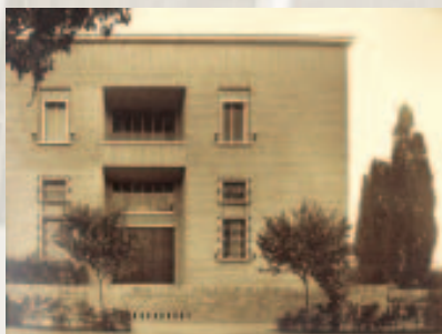
Pamje veriore e fasadës.