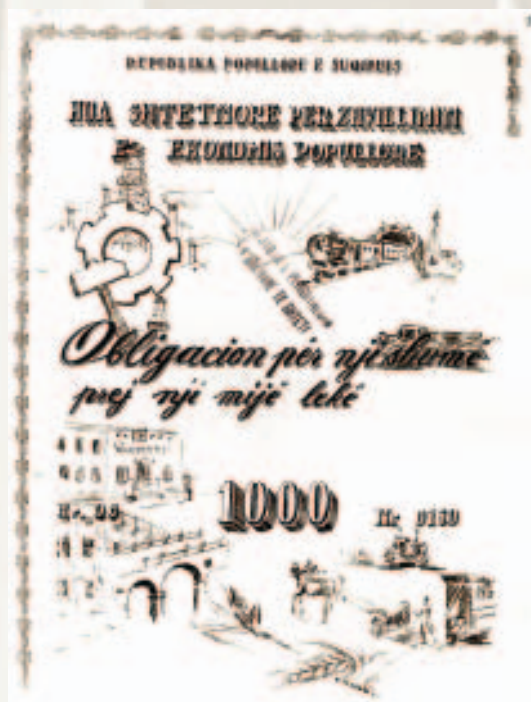
Huaja e parë shtetërore, 1949.

Me dekretin nr. 891, datë 15.07.1949 u emetua huaja e parë shtetërore në shumën prej 250 milionë lekësh. Kjo hua u emetua për zhvillimin e ekonomisë me një afat njëzetvjeçar (1 mars 1949 -1 mars 1969).