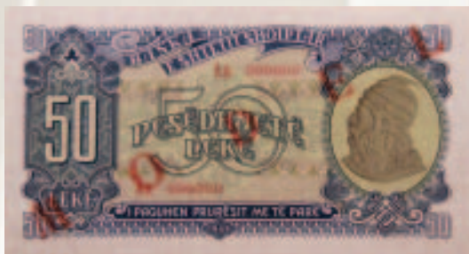
Kartëmonedhë e vitit 1949.

Kartëmonedhat e emisionit të vitit 1949, me të njëjtat pamje, u rishtypën edhe në vitin 1957, duke ndryshuar vetëm vitin nga 1949 në 1957.