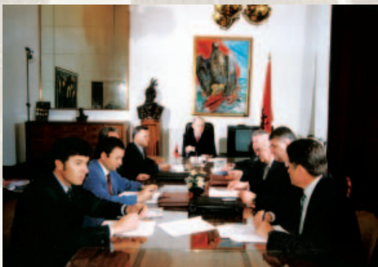
Foto e Këshillit Mbikëqyrës, në sallën ku mbahen mbledhjet e këtij këshilli.

Këshilli Mbikëqyrës i Bankës së Shqipërisë me vendimin nr. 34, miraton rregulloren "Për nxjerrjen dhe sjelljen nga jashtë shtetit të kartëmonedhave e monedhave metalike shqiptare, që kanë kurs ligjor". Kjo rregullore ka për qëllim të përcaktojë sasinë dhe procedurat për nxjerrjen dhe sjelljen nga jashtë shtetit, të kartëmonedhave dhe të monedhave metalike shqiptare, të cilat kanë kurs ligjor brenda territorit të Republikës së Shqipërisë.