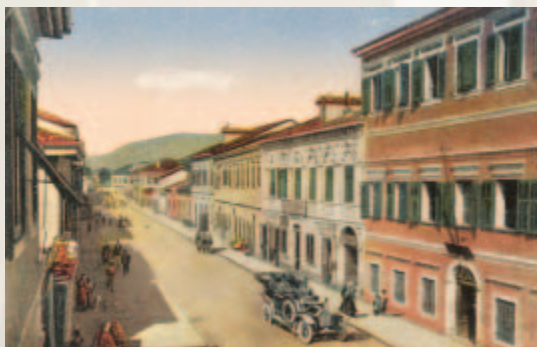
Foto e rrugës ku ndodhej selia e Filialit Shkodër, në vitet '30.