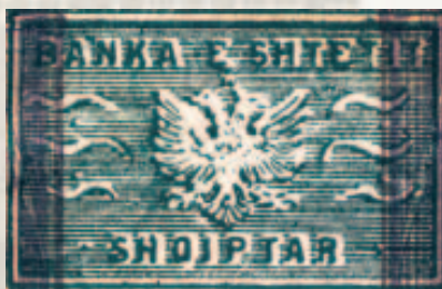
Vulë katërkëndëshe me përmasa 52x34 mm.

Me zhvillimin e ngjarjeve të pas Luftës II Botërore edhe në Shqipëri, pas proklamimit të Qeverisë Demokratike të Shqipërisë, filluan të duken shenjat e para të inflacionit dhe keqësimi i gjendjes së mjeteve qarkulluese (kartëmonedhave), gjendje e cila vinte nga pamundësia për të shtypur kartëmonedhë të re dhe për të zëvendësuar atë të emisionit italian që ishte në qarkullim. Në pritje të normalizimit të situatës u mendua që kartëmonedhave në qarkullim t'u vihej një shenjë dalluese, vulë katërkëndëshe me përmasa 52x34 mm, ku shkruhej Banka e Shtetit Shqiptar me shqiponjë dykrenore në mes, në të majtë të së cilës valviten tre pendë. E gjithë vula është e vijëzuar me vija paralele horizontale ku si shqiponja dhe shkrimet janë me hije..."