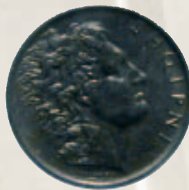
1 Lek 1927