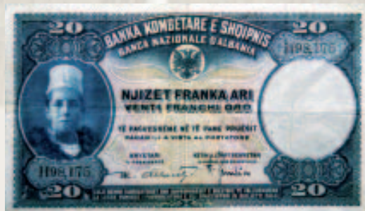
20 franga ari 1926

Filloi hedhja në qarkullim e monedhave metalike në formën e monedhave prej nikeli ½ lek, në sasinë 1.000 franga ar, pasuar me sasi të tjera pothuaj çdo dhjetëditor.