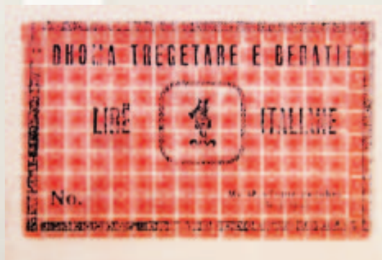
1 lirë Italiane, 1924 (Kartëmonedhë e Dhomës Tregtare Berat).