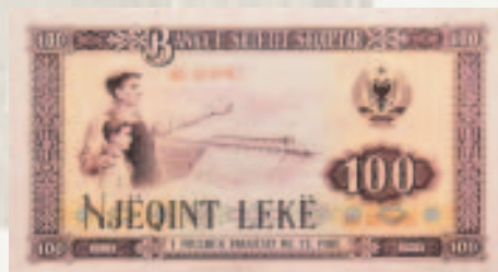
Seri e vitit 1964, e cila u rishtyp në vitin 1976.