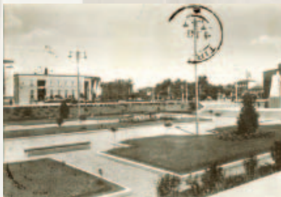
Pamje e portalit të hyrjes kryesore, 1938.

Një ent bankar emisioni, të cilit i bie përgjegjësia e rëndë për mbrojtjen e vlerës së monedhës kombëtare, ka për detyrë kryesore që të mos i shmangët kurrë atyre principeve që janë themelore për të e që mund të përmbledhen: në mbajtjen e një ekuilibri të drejtë midis qarkullimit, mbulesës, depozitave e derdhjeve të ndryshme, si dhe në dhënien e kredive përgjithësisht afatshkurtra dhe vetëm atyre që janë në gjendje të paraqesin garancitë e nevojshme.