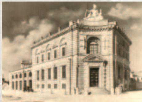
Foto e Degës së Bankës Durrës.

Me datë 30 me urdhër të Komandës, Divizioni i Dytë, kasafortat janë mbyllur. Janë tërhequr me urdhër të komandës partizane, një pako me mall nga magazinat e përgjithëshme dhe revolja e rojes së atyre magazinave. Gjendja e arkës së degës në kartëmonedha, në monedha metalike e në çeqe është 129.800 franga shqiptare. Nga ana tjetër, dega disponon module çeqesh për t'u vlerësuar për gati 1.800.000 franga shqiptare.