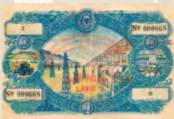
Huaja shtetërore e konvertuar për zhvillimin e ekonomisë dhe të kulturës të RPSH.

Drejtori i Përgjithshëm i Bankës së Shtetit Shqiptar i kërkon Zëvendës-presidentit të Bankës së Shtetit në Moskë, mbulimin e mbishpenzimeve në fondin e pagave.