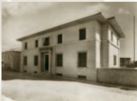
Foto e Degës së Bankës Sarandë.

largimit trupat gjermane kanë tërhequr me forcë shumën që gjendej në arkë, në pothuaj 300.000 franga ari, shumë kjo e transferuar në Tiranë, dhe e dorëzuar gati krejtësisht kësaj qendre.