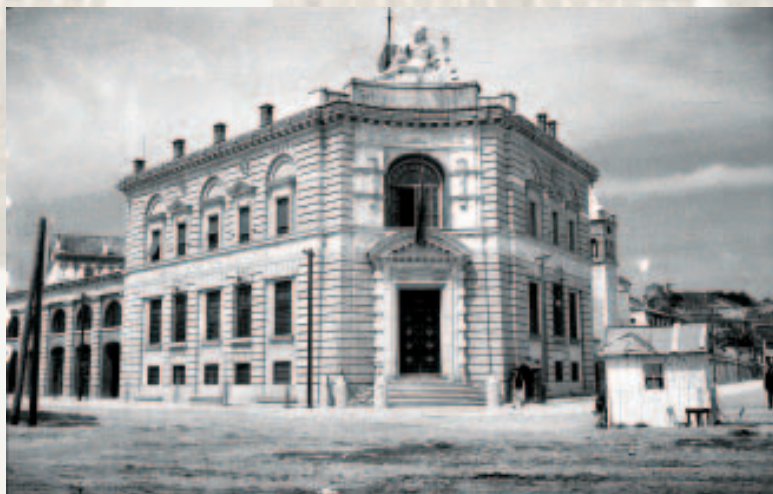
Foto e Filialit të Bankës Kombëtare të Shqipërisë, Durrës.

Hapet Filiali i Bankës Kombëtare të Shqipërisë në Durrës.