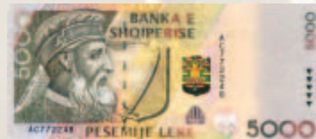
Seri e vitit 1996 (emisioni i ri).