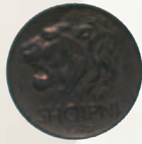
5 qindar Leku 8.02.1926