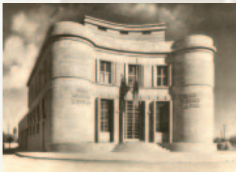
Foto e Degës së Bankës Korçë.

mallrat e disponueshme në magazina. Me kërkesën e Këshillit Nacionalçlirimtar, autoritetet ushtarake kanë tërhequr nga magazinat pjesë të bereqetit të depozituar atje nga Sasteb dhe afro 11 kuintalë lëkurë, edhe këto të depozituara dhe në pronësi të të tretëve. Dega ka marrë masat për përpilimin e gjendjes kontabël më 31 tetor 1944, dy kopje të së cilës i janë dorëzuar autoriteteve. Ndërtesa, magazinat dhe arkivi nuk kanë pësuar dëme.