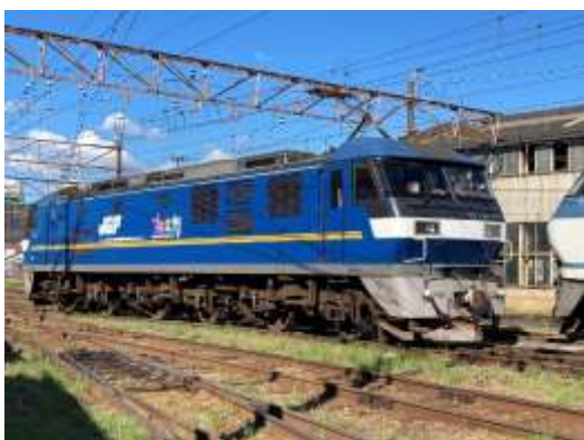
▲EF210形式309号機直流電気機関車

展示期間中は、通常は間近で見ることが出来ない車両を様々な角度からご覧いただけます。また、関連イベントも開催しますので、ぜひこの機会にお越し下さい。