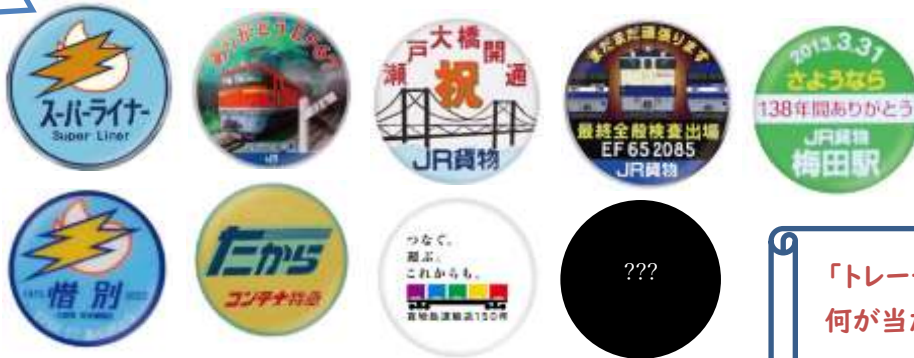
▲JR 貨物 ヘッドマーク トレーディング 缶バッジ 400 円(税込) ※全 9 種のうち 1 個入り (BOX 購入で全 9 種類コンプリート可能)