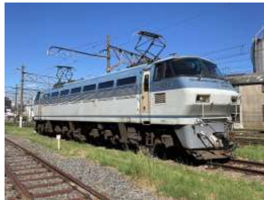
▲EF66形式121号機直流電気機関車