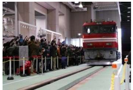
▲過去に開催した様子