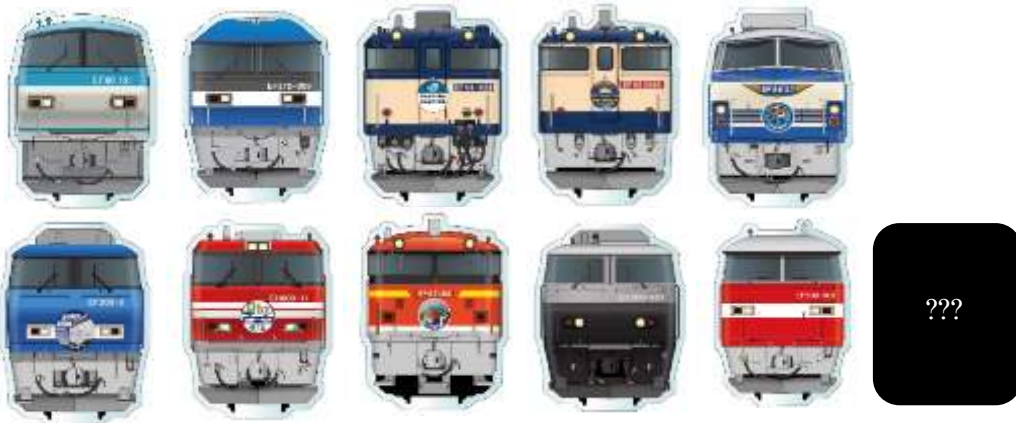
▲JR 貨物 トレーディング アクリルマグネット 750 円(税込) ※全 11 種のうち 1 個入り (BOX 購入で全 11 種類コンプリート可能)