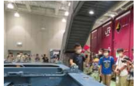
▲過去に開催した様子

【参加方法】 ・開催場所で10:00より当日分の整理券を配布します。 ・ご希望の開催時刻①～③は選択可能です。 ※整理券はなくなり次第、受付終了となります。 ※おひとり様、1枚のお渡しです。