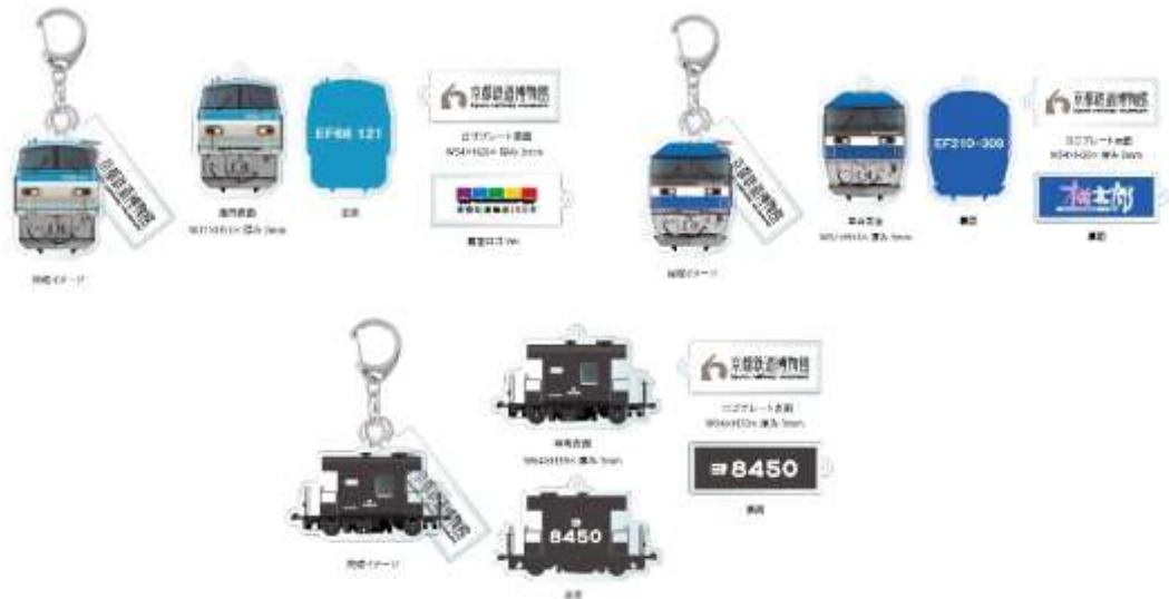
▲アクリルキーホルダー 全3種(EF66形式、EF210形式、ヨ8000形式) 各種850円(税込)