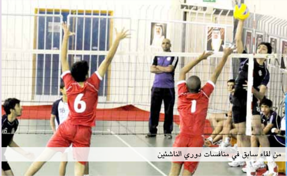
من لقاء سابق في منافسات دوري الناشئين