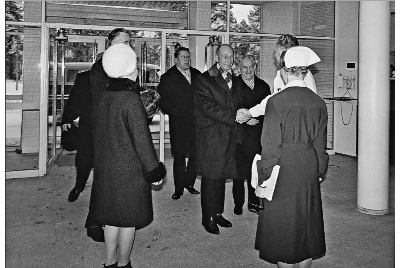
Jaroslavl-ystävyyskaupunkivierailu Jyväskylän Sädessä 8.12.1967.