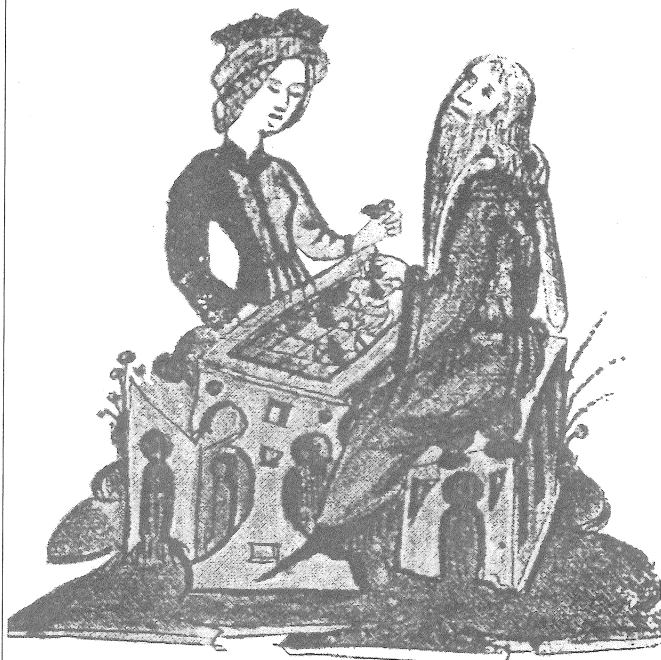
Morolf (als pelgrim verkleed) herkent Salme (de vrouw van Salman) bij een schaakpartij. Illustratie uit een van de 15de-eeuwse Salman und Morolfhandschriften . Württembergische Landesbibliothek, Stuttgart, Cod. HB XIII.2, fol 309 v o .