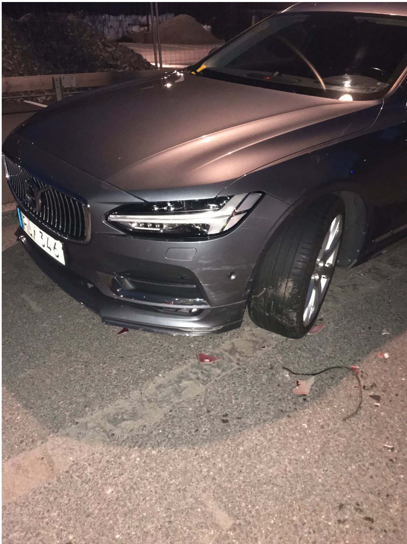
9. Arvid Tydéns Allé i Solna. Pb PJX 346.