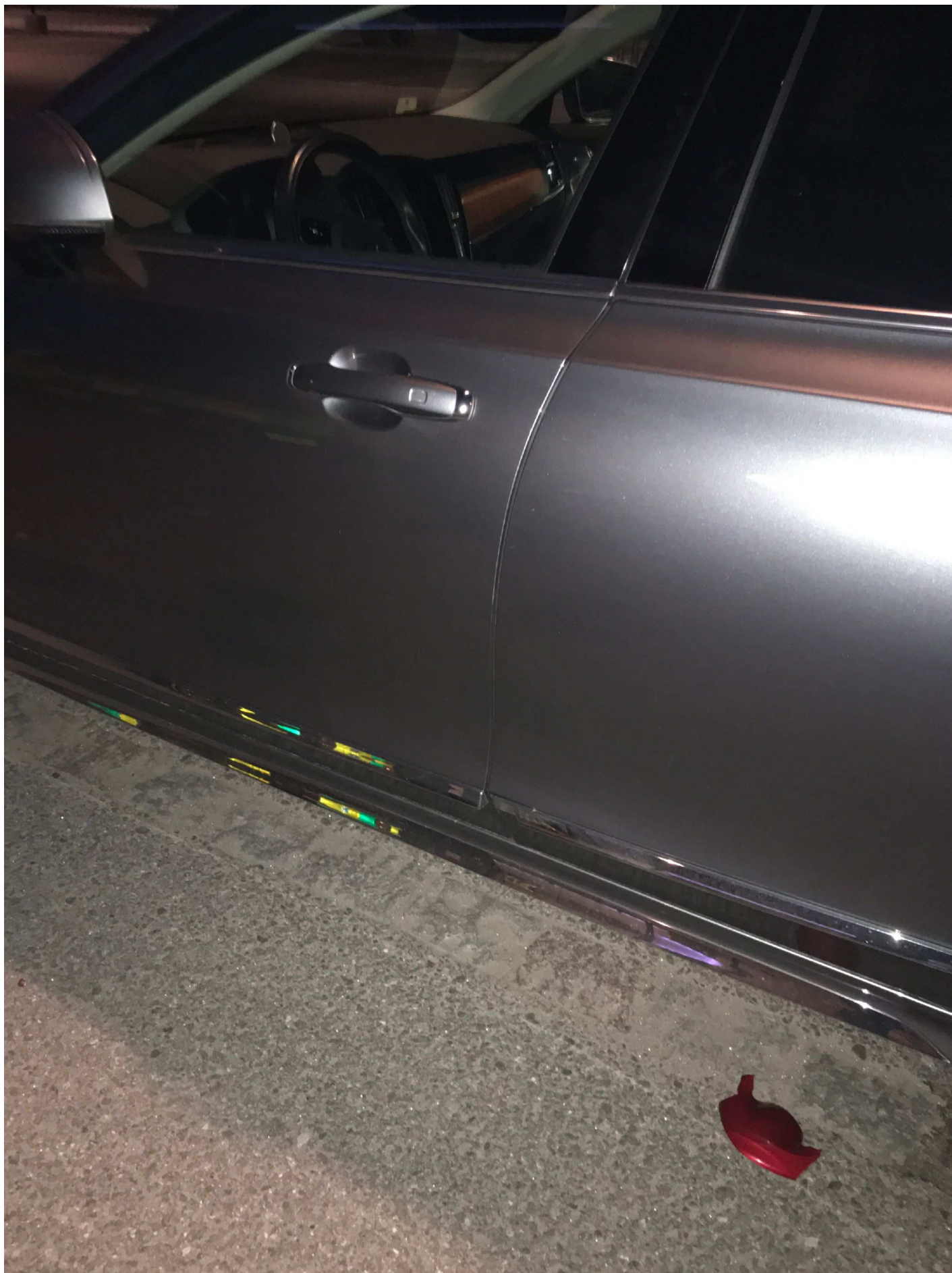
7. Arvid Tydéns Allé i Solna. Pb PJX 346.