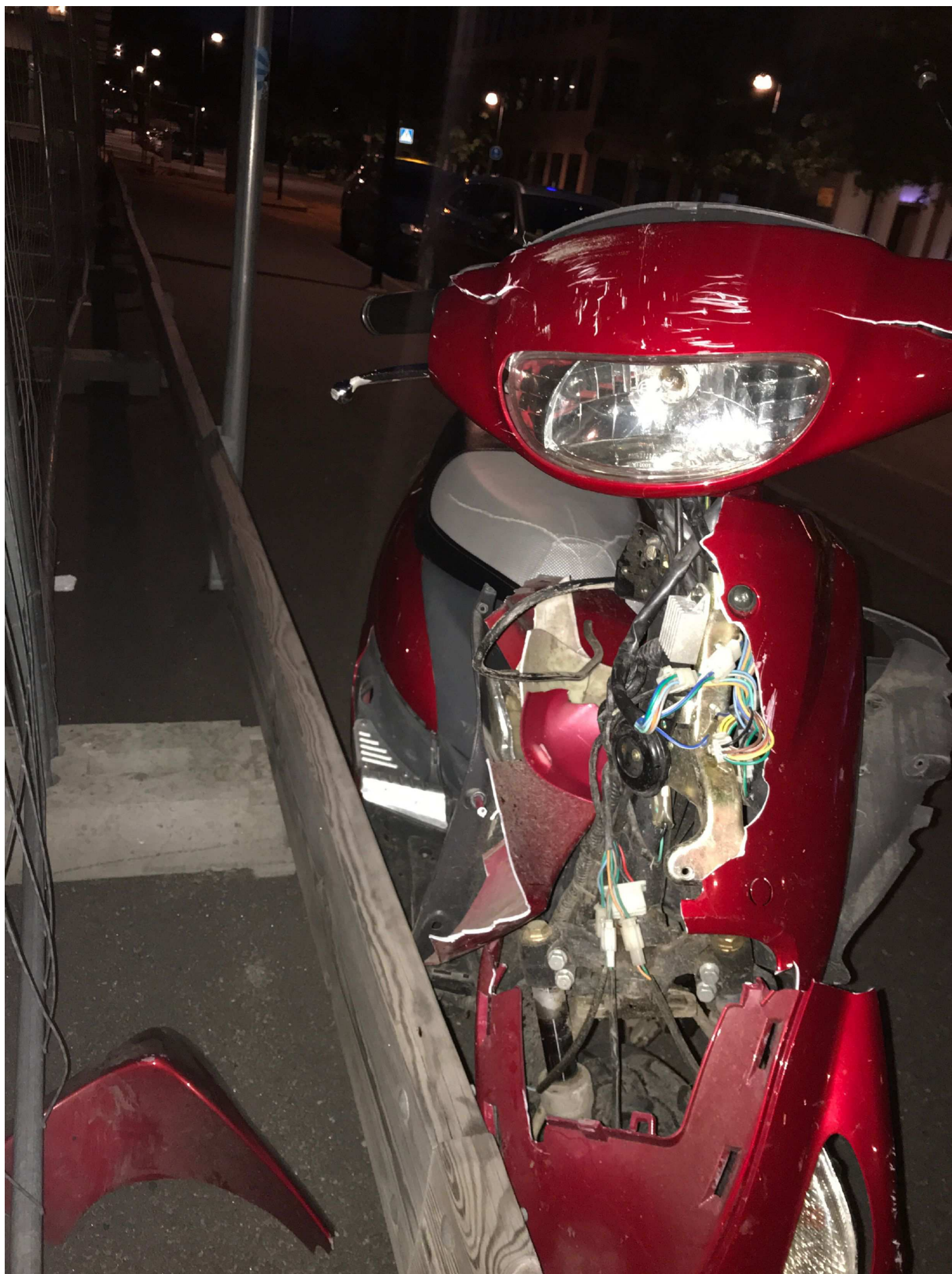
4. Arvid Tydéns Allé i Solna. Moped DNL 787.