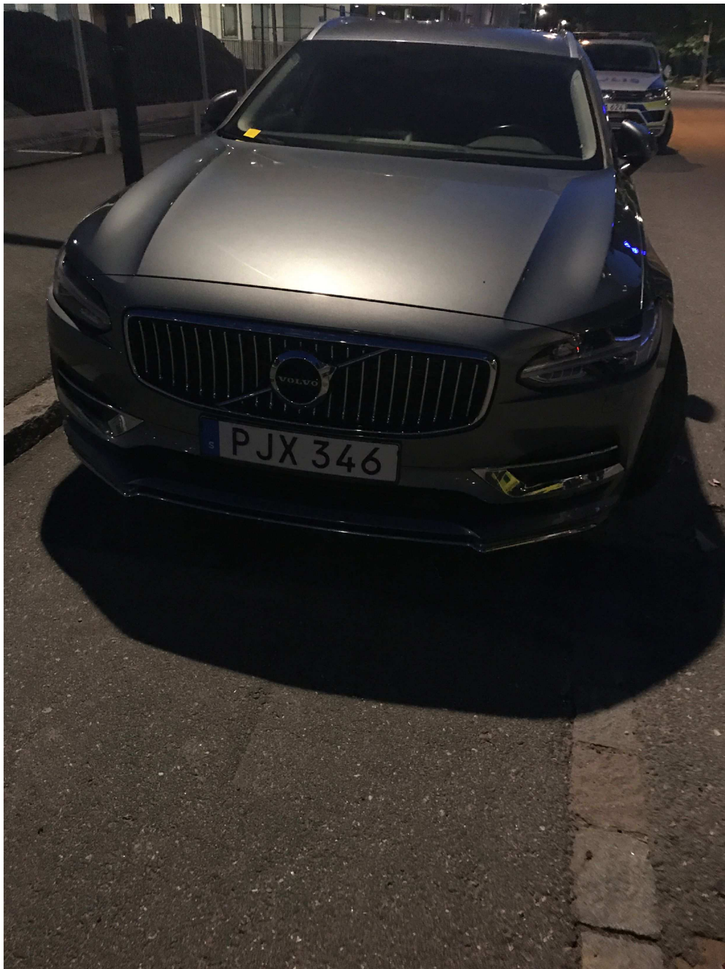
10. Arvid Tydén's Allé i Solna. Pb PJX 346.