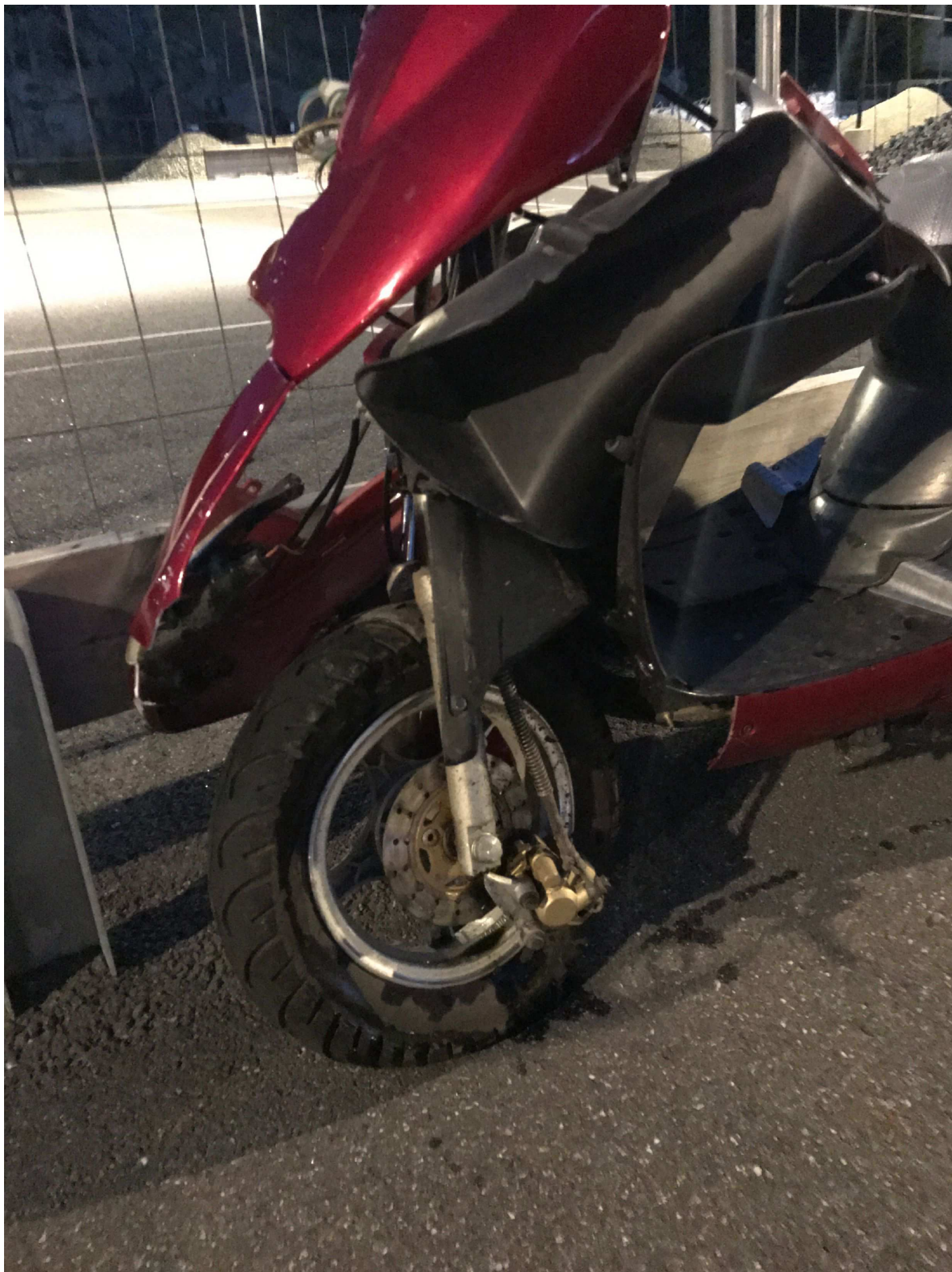
2. Arvid Tydéns Allé i Solna. Moped DNL 787.