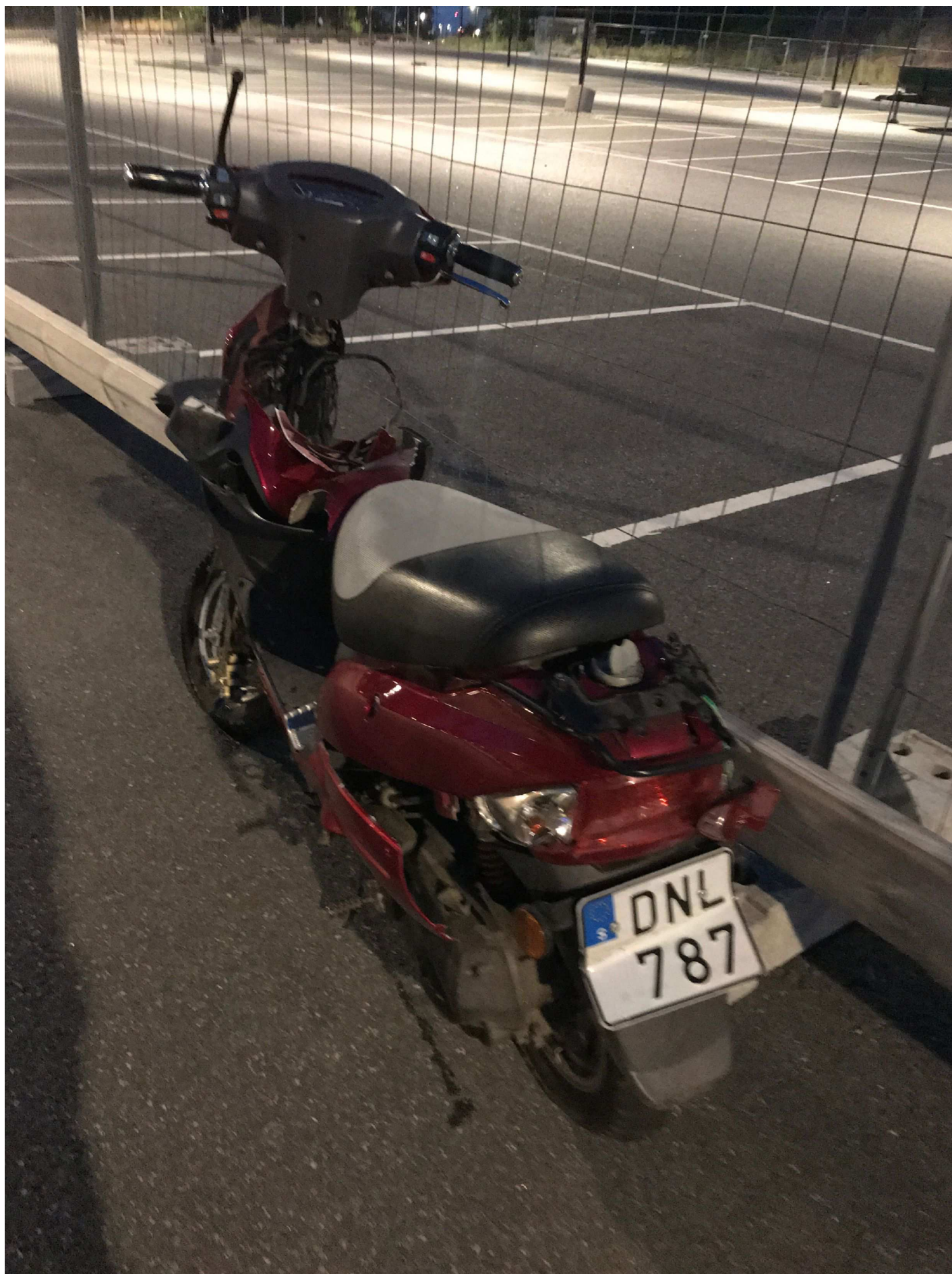
1. Arvid Tydéns Allé i Solna. Moped DNL 787.