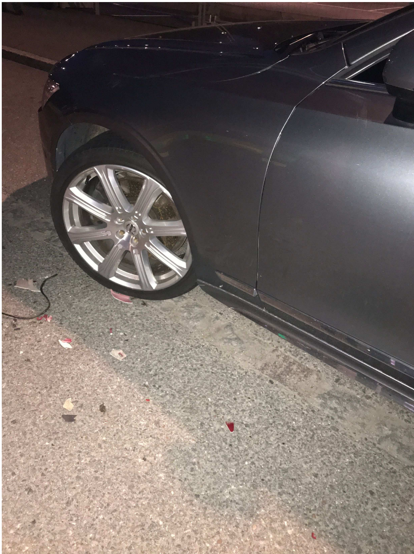
6. Arvid Tydén's Allé i Solna. Pb PJX 346.