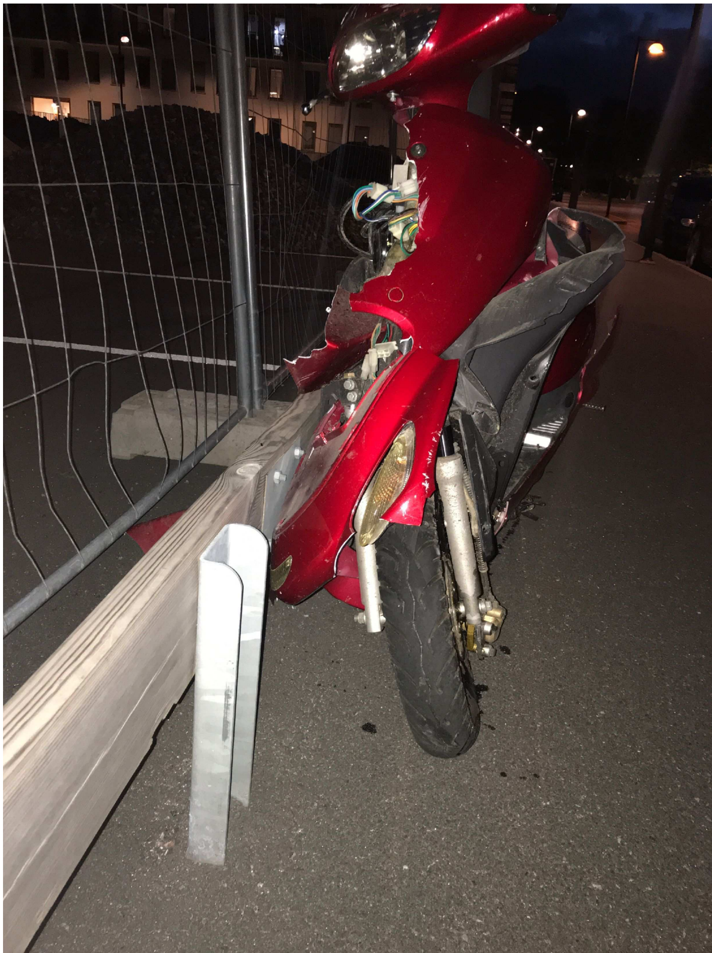
3. Arvid Tydéns Allé i Solna. Moped DNL 787.