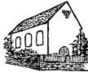
Alte Winzinger Kirche