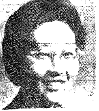
Ku Sen-in (Chiny)