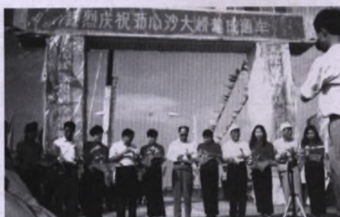
1994年4月29日,沥心沙大桥建成通车。