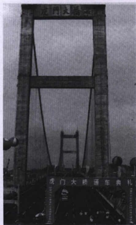
1997年6月9日,横跨东莞、番禺的虎门大桥通车。