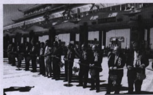
1998年9月3日,番禺大桥建成通车剪彩盛况。