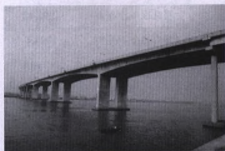
2001年1月,番禺又一条特大桥梁北斗大桥建成通车。