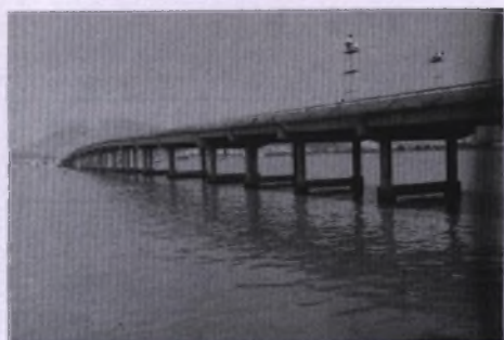
亭角大桥 (1992 年摄)