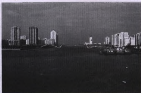
丽江大桥 (1998 年摄)