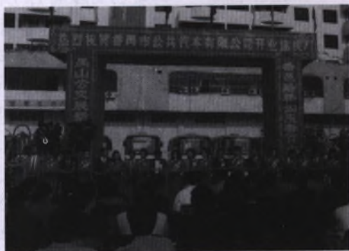
1991年5月26日,市桥镇内的公共汽车开通。

2000年,市交通局抓住个体营运中巴到期报废更新的机会,实行一次性强制报废;取消个体大中巴的挂靠模式,在专线经营的基础上,逐步向股份制公司转型。6月8日,市交通局批准