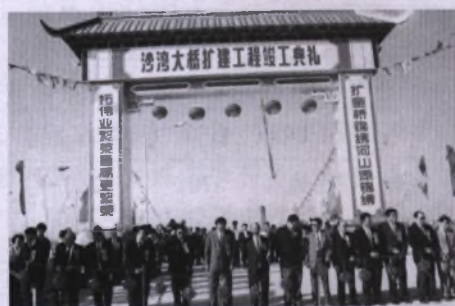
2001年10月28日,沙湾大桥扩建工程竣工剪彩盛况。