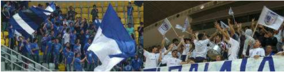
Οπαδοί της Ανόρθωσης (αριστερά) και της ΑΕΚ Καραβά (δεξιά) λίγο πριν αρχίσει ο "τελικός της προσφυγιάς" στο Στάδιο "Σπύρος Κυπριανού" της Λεμεσού.