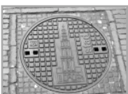
putdeksel op de Westerhaven