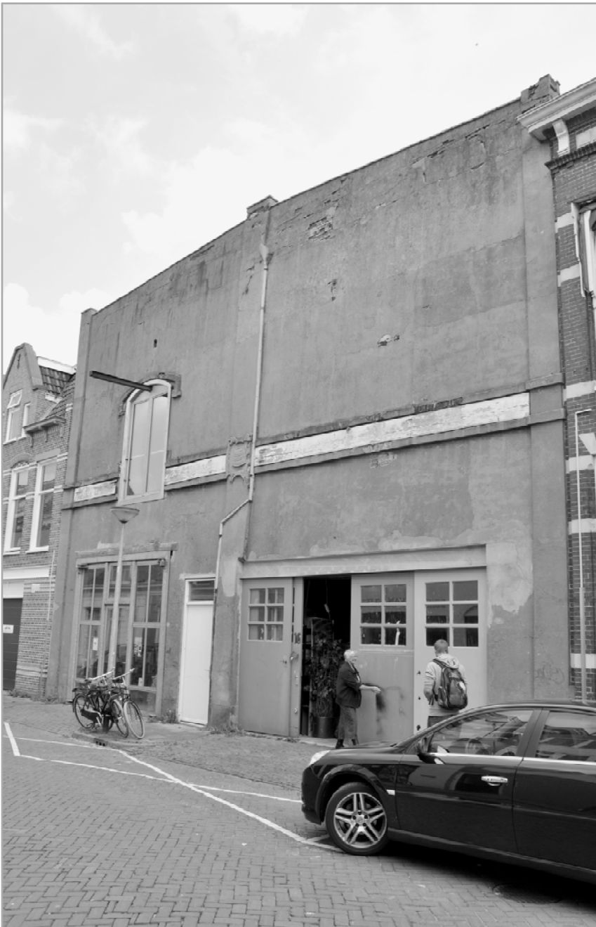
Voorgevel ijspakhuis

In de Westerhavenstraat staat een groot gebouw, aangesmeerd met grijs cement. Een saaie gevel, opvallend door zijn