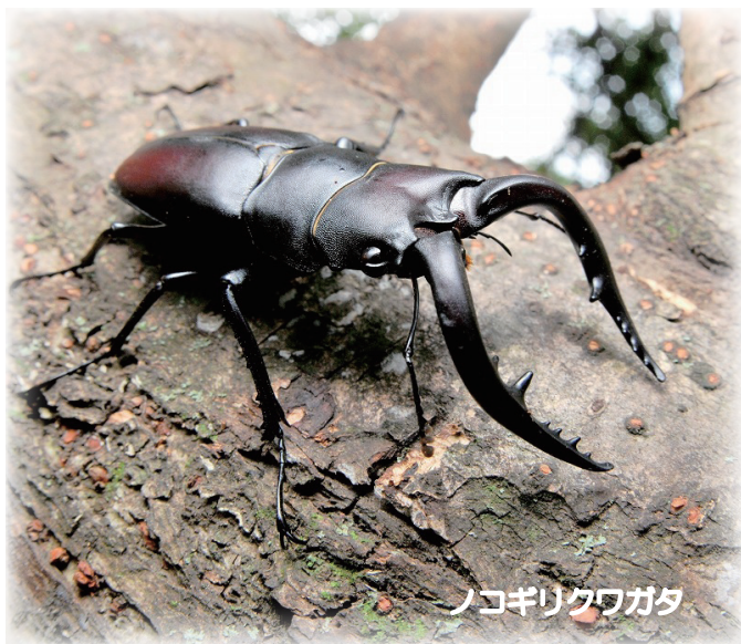
ノコギリクワガタ

子どもの頃、昆虫図鑑をめくると定番のシーンに目が留まりませんでしたか？ そう、カブトムシとノコギリクワガタのケンカ。カブトムシの角でノコギリクワガタが投げ飛ばされる構図です。