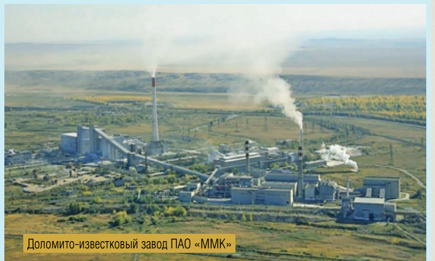
Доломито-известковый завод ПАО «ММК»

Известняково-доломитовое производство. История известнякового и доломитового карьеров берёт начало в 1930 году. Пятого мая начата добыча известняка в Белом логу. Из-за непригодности известняка этого месторождения для строительных нужд открывается новый известняковый карьер на левом берегу второго русла реки Урал. В 1931 году вводится в строй дробилка, строятся напольные печи, загрузка и выгрузка которых производится вручную. Известняковый (Агаповский) карьер включён в состав горного хозяйства комбината. В 1932 году началась добыча доломита на северо-западном участке карьера. В 1934 году были введены в строй дробильно-сортировочная фабрика и четыре шахтные печи. С 2000 года началось техническое обновление: строительство новых шахтных и вращающихся печей дало возможность отказаться от изношенного оборудования на старой площадке, внести весомый вклад в реализуемую на ММК эко-