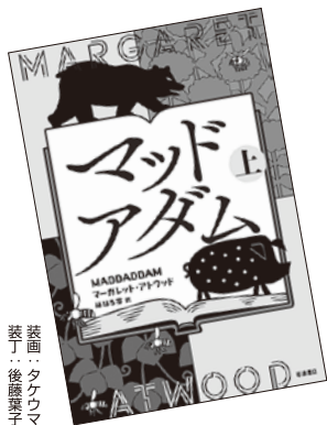
装画：タケウマ 著者：後藤葉子

謎のウイルスにより人類はほぼ絶滅し、地上は廃墟と化した。生き残ったのは一握りの人びとと「理想」の人造人間クレイカー、そして残忍な凶悪犯たち。未来を握るのは誰なのか。すべてを賭けた闘いが始まる……。ノーベル賞有力候補の作家が、地球と人類の未来を壮大なスケールで構想した近未来小説三部作、ここに完結！