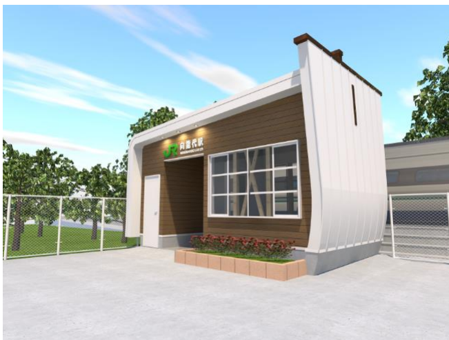
【新駅舎 イメージパース】