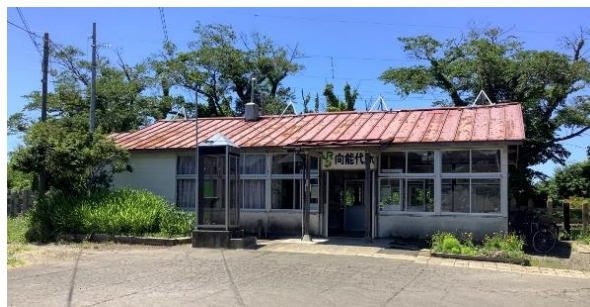
【既存駅舎 外観写真】