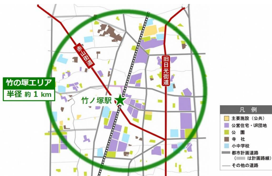
■竹ノ塚駅周辺地図（検討中の竹の塚エリアデザイン計画の範囲）

今後も竹ノ塚駅周辺にお住まいの方々の生活利便性を向上させるとともに、暮らし続けたいまちとなるよう、まちの活性化と持続可能なまちづくりを進めてまいります。