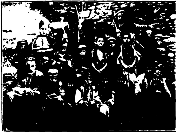
ԳԻՒՂԱՇԷՆ (ՍԱՍՈՒՆ) ԳԻՒՂԱՑԻՆԵՐ ԳՊՐՈՑԻ ԱՇՂԱԿԵՐՏՆԵՐ ԵՒ ԾՆՈՎՔՆԵՐ

բան-Ֆարձրաւանդակի զանազան շրջանները, հիմք կը դնեն Հ. Յ. Դաշնակցութեան: Գրիտար կը թաթուլի և բնկերներուն գործը յուսայրման այդ օրերուն, եղած անյաջողութիւնները պատճառ էին դարձած, որ շատնան յրդատեսներն ու մասնիչները: Փողովուրդը նախկին հաւատով չէր վերաբերուեր յեղափոխական գործիչներուն ու զազափարներուն, իսկ ժողովուրդին առողջ մասն ալ զբաղան զբաւականներ կը պահանջէր շարունակելու համար յեղափոխութեան գործը: