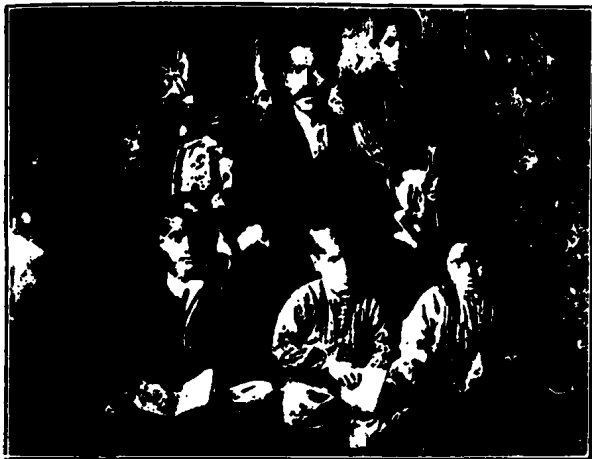
ՓՈՒՐԻՆ ԳԻՏԵԼԻ (ՏԱԼԻՈՐԻԿ) ՈՒՍՈՒՑԻՉԸ ԻՐ ԱՇԱԿԵՐՏՆԵՐՈՎ

Համապատասխանելին անոր: Խրիմեանի ժամանակներէն սկսած մինչև 1915 ան եղած է բոլոր դործերու եւ ղէպերու վկան ու միաժամանակ Յեսուսի նման ժողովրդական առաջնորդ: Ծնուած էր Ահարոնք գիւղը. իր վանական կրթութիւնը ստացած էր Սբ. Կարապետ վանքին մէջ եւ, ներշնչուած Հայրիկէն ու յետագայ յեղափոխականներէն, դարձած էր ո՛չ միայն հակուոր, այլ նաեւ յեղափոխական առաջնորդ: Խարախանեան Ներսէս վրդ. -ի արտուելէն յետոյ Կինճի առաջնորդական հովուութիւնը թողած ան կը շտապէ Ս. Կարապետ, Մուշը թափուր չթողելու համար եւ Ներսէս վրդ. -ի տեղը բռնելու, մանաւանդ որ Սասնոյ գէպերը կը պատրաստուէին: Սասնոյ կոիւնքէն յետոյ, երբ ընդհանուր վհատութիւն եւ լքում կը տիրէր, ան կը ջանայ պահպանել ժողովուրդի մէջ ազատասունչ ոգին եւ ամէն միջոցներով նպաստել Սասնոյ վերաշինութեան: