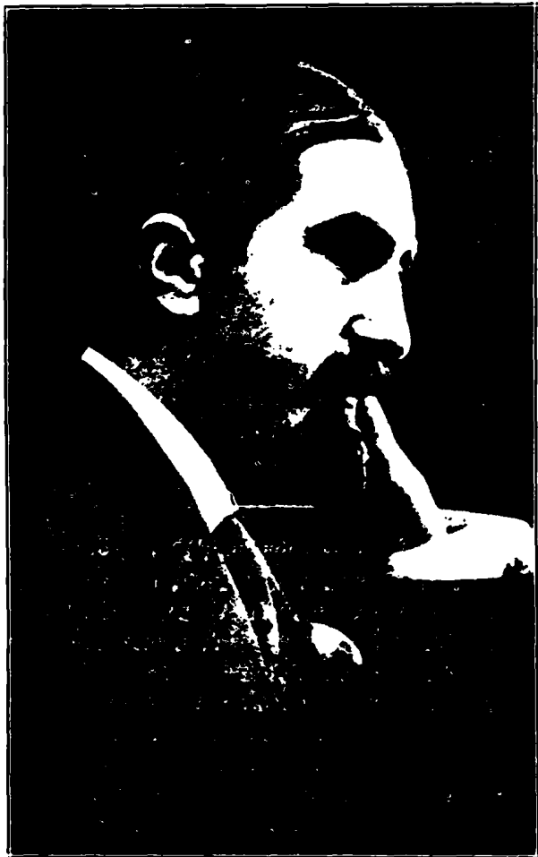
ԱՏՈՄ ԵԱՐՃԱՆԵԱՆ (ՍԻԱՄԱՆԹՕ)

Սիամանթօ հականապէս բանաստեղծ էր, դիտող բանաստեղծ մը: Իր քնարը բոլորովին տարրեր յատկանշական մը ունէր: Անոր լարերը կը թրթռային միայն դիւցազներգութեան համար. Սիամանթօ իրրեւ հայ անհատ, Ատոմ Եարճանեանն էր, — ընկերական, սովորաբար մեղմ, բայց դիւրարորոք, ցասումի կարճ եւ վաղանցուկ թոպէներով, նիհար, գրեթէ բարձրահասակ, ընդհանուր կերպով վայելչակազմ անձնաւորութիւն մը: Իրրեւ անհատ