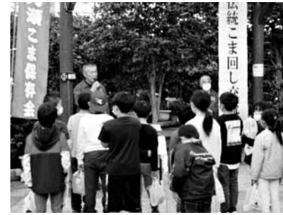
世界の椿館での伝統独楽廻し交流会

▷その他＝前期日程の1次試験を受験した人は、後期日程の同じ職種を受験できません。また、後期日程の募集職種、人数、受験資格などの詳細は、7月中旬に公表予定です。