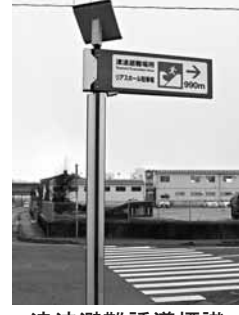
津波避難誘導標識 確認しておきましょう

どこへ逃げるのか、それまでの避難ルートはどうか、徒歩で登れるのか、安全な場所までの所要時間などを日ごろから確認しておきましょう。家庭や職場において津波避難する際には、すぐに飛び出せるように非常持ち出し品を、下表を参考に、手近にまとめておきましょう。