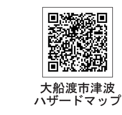
大船渡市津波ハザードマップ