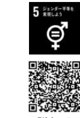
詳細は市ホームページをご確認ください

▽応募締切日 3月22日(水) ▽その他 審議会出席の際に委員報酬と旅費を支給します。 ▽応募先・問い合わせ先 男女共同参画室(☎内線278/FAX 278878) ▽対象 市内にお住まいの人の子どもで、学校教育法に規定する高等学校・大学・短期大学・高等専門学校・大学院・専修学校に在学または入学する人 ▽通信教育は該当しません。 ▽募集人員 20人程度 ▽奨学金の貸与額 ・高等学校 10,000円 ・大学など 30,000円 ▽貸与利率 無利子 ▽貸与期間 正規の修学期間 ▽償還期間 貸与が終了してから1年据え置き後10年以内 ▽申込期間 4月3日(月)～4月25日(火)