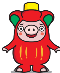
大船渡市PRキャラクター「おおふなトン」