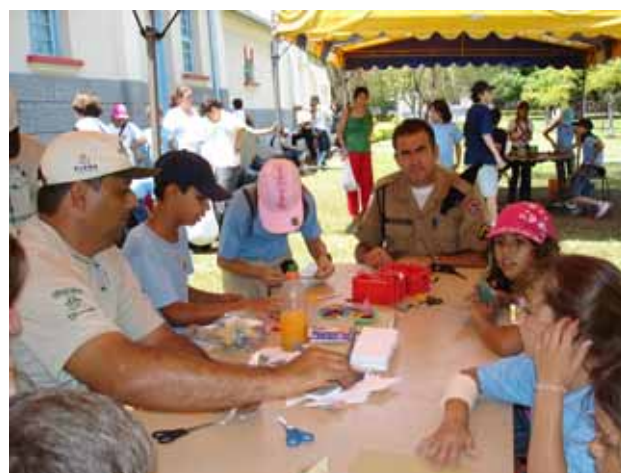
Figura 11 - Oficinas Pedagógicas durante a Semana dos Dinossauros