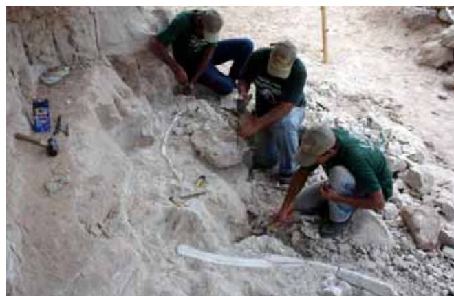
Figura 9 - Escavações paleontológicas sistemáticas realizadas no km 153 da BR 050 Figure 9 – Systematic paleontological excavations performed in km 153 of BR 050 road

mamíferos crustáceos de água doce além de microfósseis de plantas.