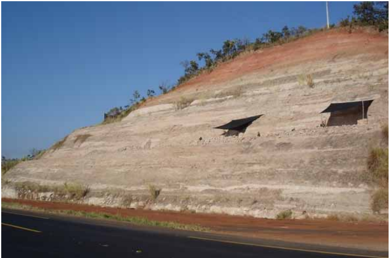
Figura 3 - Sítio Paleontológico da Serra da Galga - BR 050 - km 153 Figure 3 – Paleontological Site of Serra da Galga - BR 050 - km 153