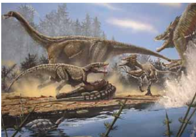
Figura 7 - Reconstrução ambiental da região de Uberaba há 70 milhões de anos.

Muitos fósseis de vertebrados cientificamente relevantes provêm da Formação Marília, em especial da região de Peirópolis. Há um importante anfíbio - Baurubatrachus pricei Baez & Peri, 1989 - o qual encontra-se praticamente completo (Baez & Peri, 1989). Dentre os crocodilomorfos temos Itasuchus jesuinoi (Price, 1955), Peirosaurus tormini (Price, 1955) e Uberabasuchus terrificus (Carvalho, et al. , 2004). Outros répteis são: um lagarto iguanídeo Pristiguana brasiliensis (Estes & Price, 1973), e um dinossauro maniraptora relacionado aos dino-aves (Novas et al. , 2005). Também ovos fósseis são conhecidos desta região (Magalhães Ribeiro, 1999). (Fig. 7)