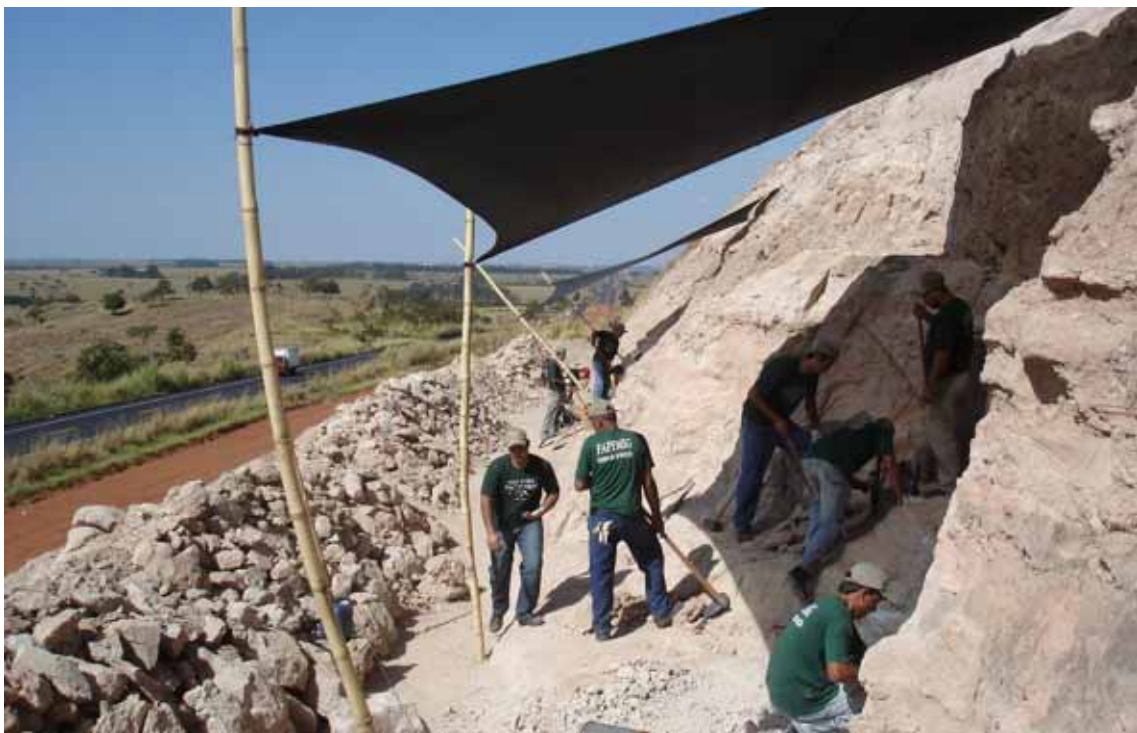
Figura 4 - Escavações paleontológicas realizadas no km 153 da BR 050 Figure 4 – Paleontological excavations performed in km 153 of BR 050 road

Ainda que muito trabalho já tenha sido executado toda esta região ainda encontra-se intocada. Possui imensas áreas potencialmente fossilíferas que, com o