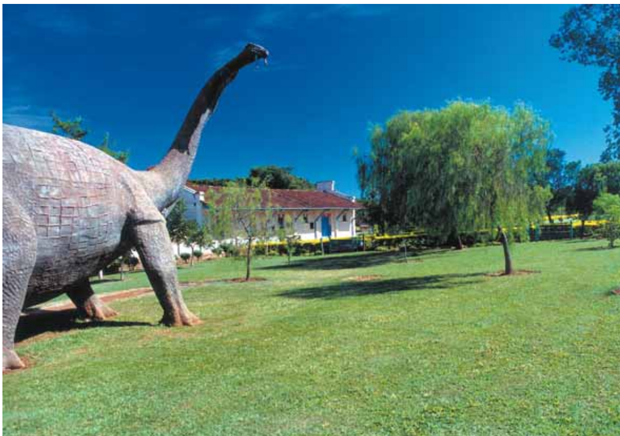
Figura 8 - Museu dos Dinossauros de Peirópolis - Uberaba-MG Figure 8 – Museum of the Dinosaurs of Peirópolis - Uberaba- state of Minas Gerais

Desde a implantação, o Centro Price tem norteado suas ações a fim de atender a três objetivos básicos: proteger os fósseis e depósitos fossilíferos, fomentar, apoiar e realizar pesquisas geo-paleontológicas e divulgar conhecimentos. Para agilizar os trabalhos e possibilitar a ampliação do acervo fóssil, a instituição possui equipes de escavações, com coletas sistemáticas anuais por 6 meses, únicas neste gênero no Brasil.