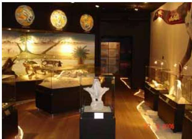
Figura 10 - Exposição do Museu dos Dinossauros Figure 10 - Exposition of the Dinosaurs Museum (Museu dos Dinossauros)

Para levar o conhecimento ao público leigo de forma simples e didática, foi criado o Museu dos Dinossauros (Fig. 10). Funcionando anexo ao Centro de Pesquisas, sua mostra inclui: réplicas, cenários, dioramas, além de um acervo bastante representativo de fósseis dos diversos componentes da biota desta região, em especial os dinossauros.