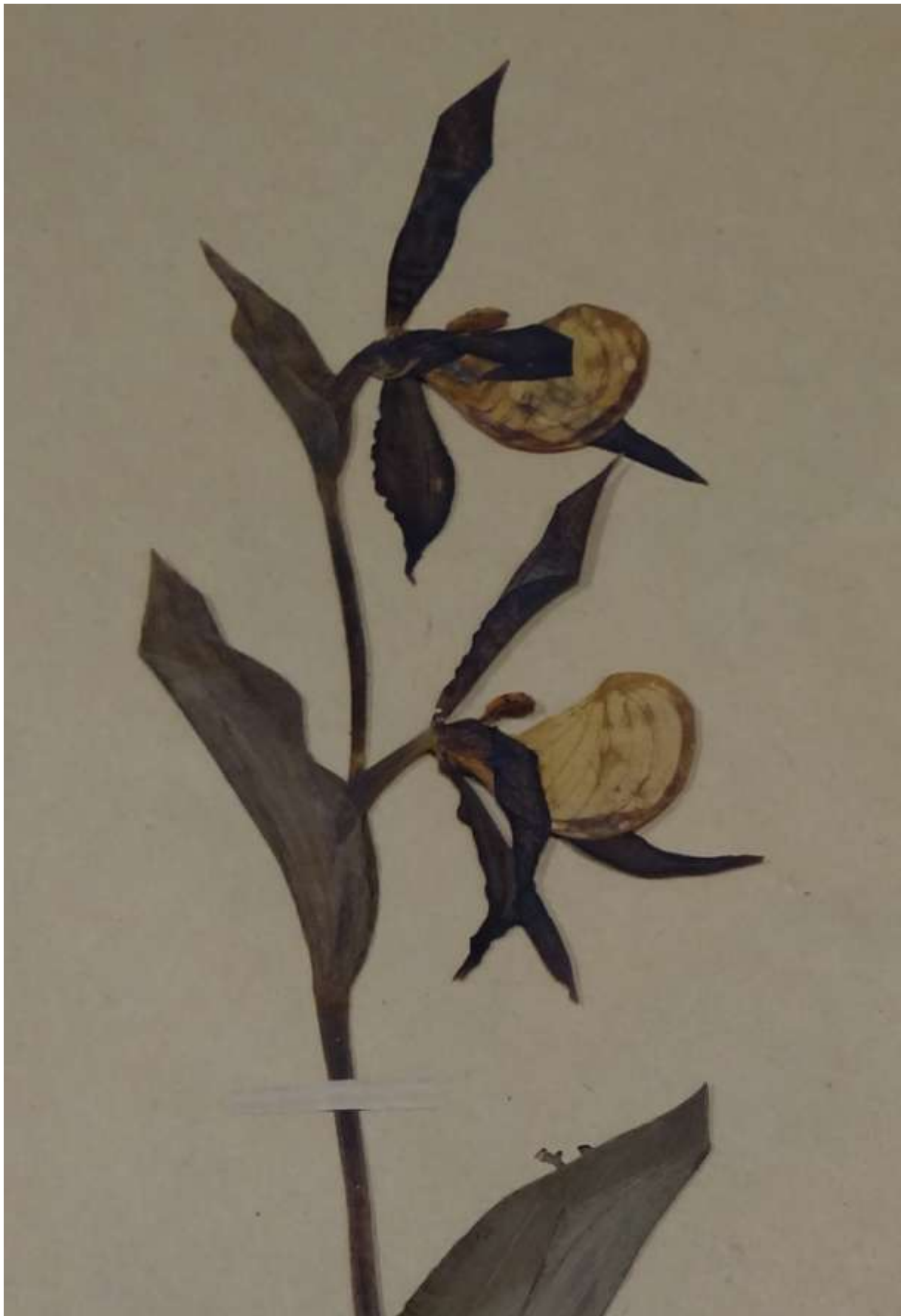
Cyripedium calceolus (Sapot-de-Vénus) Herbier MANTZ (Herbier de STRASBOURG)