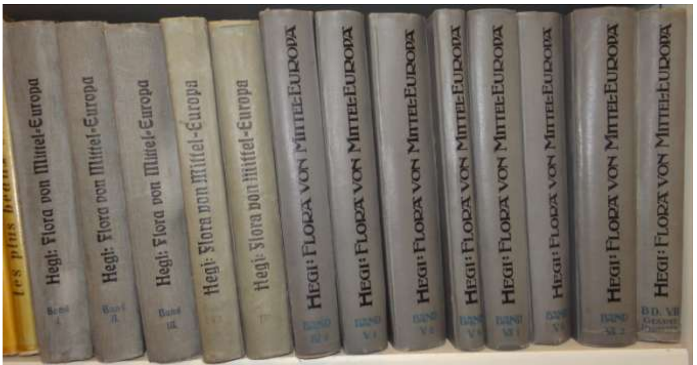
Bibliothèque d'Emile MANTZ (ouvrages conservés par la famille MANTZ)