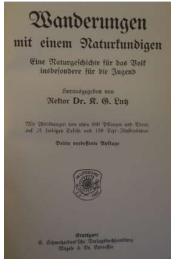
Bibliothèque d'Emile MANTZ (ouvrages conservés par la famille MANTZ)